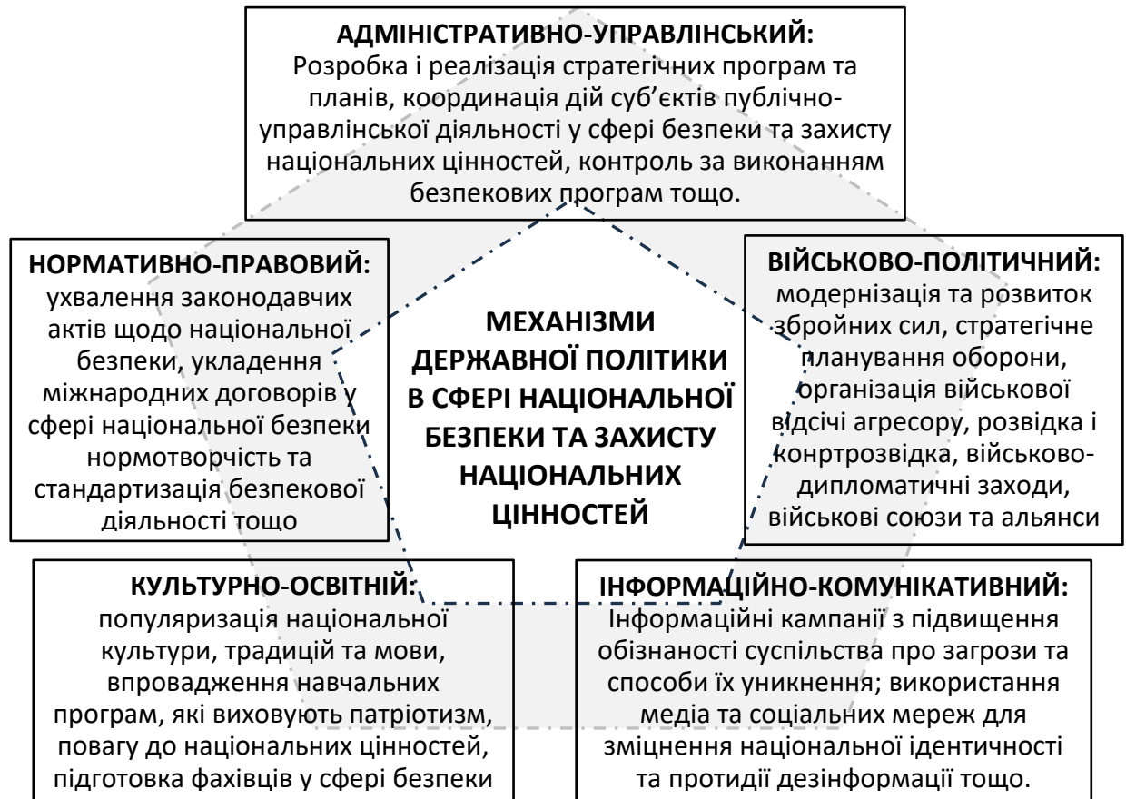
Рис. 2.2. Система механізмів державної політики в сфері національної безпеки та захисту національних цінностей

управлінські, військово-політичні, інформаційно-комунікаційні та культурно-освітні механізми та інструменти (Див. Рис. 2.2).