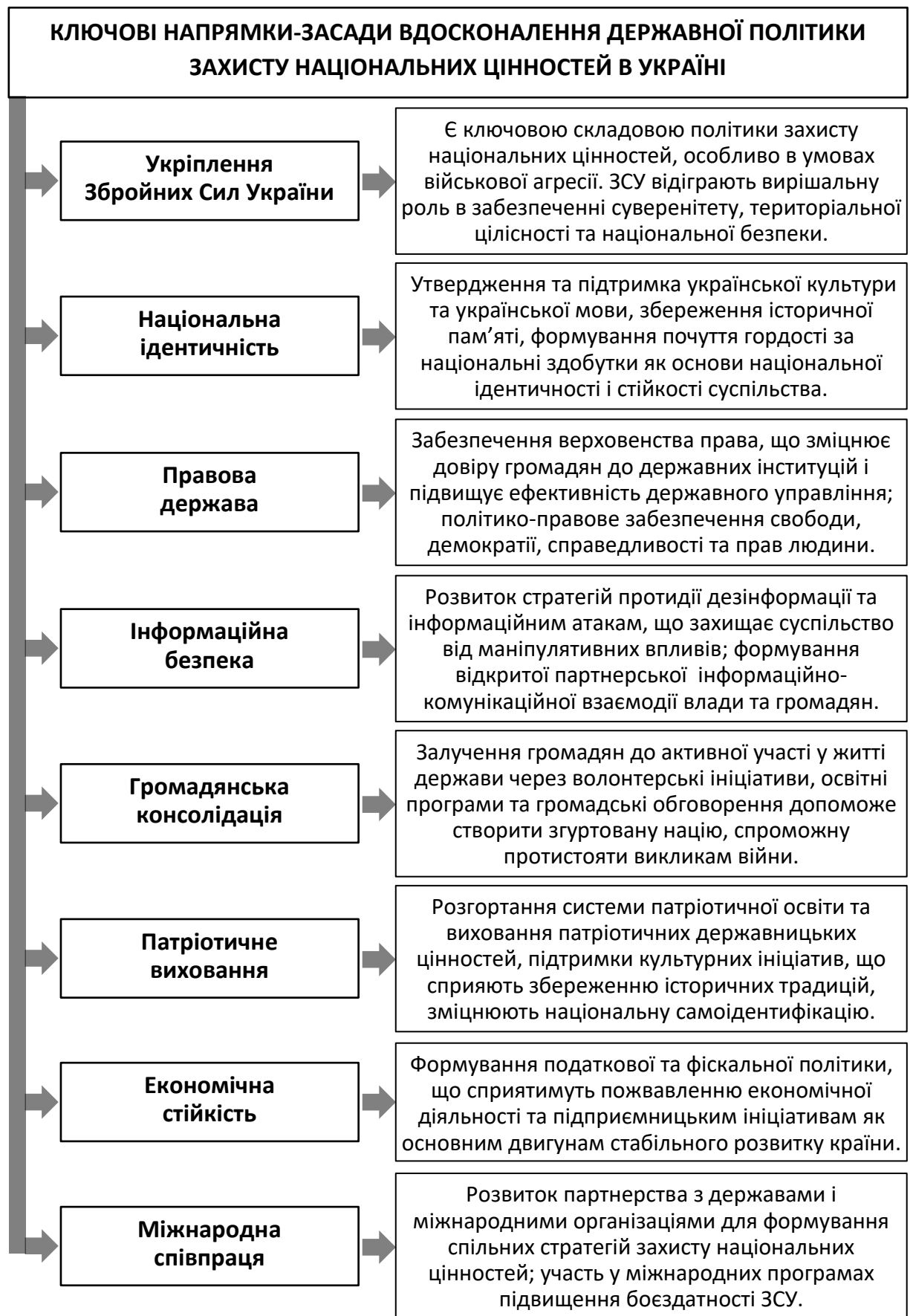
Рис. 2.3. Основні складові вдосконалення державної політики захисту національних цінностей в Україні

Укріплення Збройних Сил України (ЗСУ) є ключовою складовою