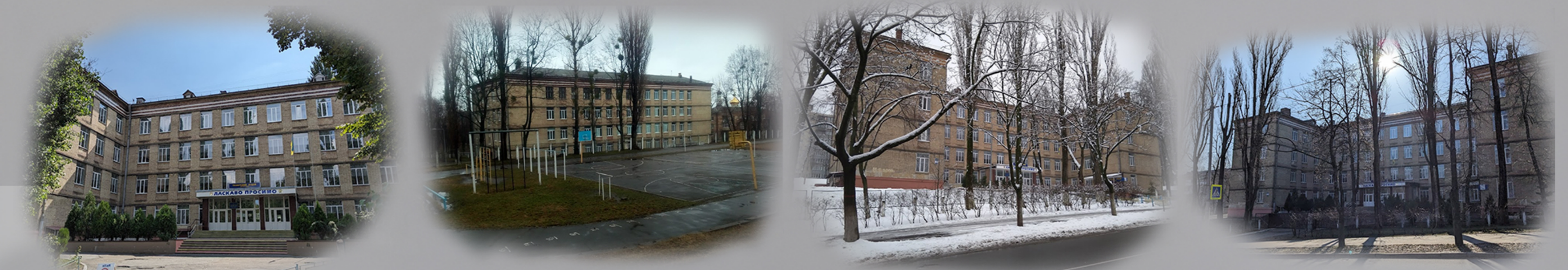
Розташування ділянки в межах міста