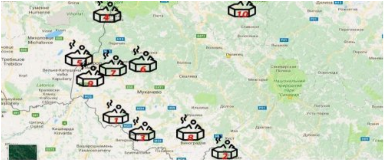
Рисунок 2.3 – Термальні зони Закарпаття

Термальний комплекс «Косино» є одним із найбільших і найвідвідуваніших оздоровчо-рекреаційних об'єктів Закарпатської області. Він розташований у селі Косонь Берегівського району, на території унікального природного середовища – дубового гаю віком понад 200 років. Завдяки поєднанню сучасної інфраструктури та природних лікувальних ресурсів комплекс орієнтований на сімейний відпочинок, оздоровлення та релаксацію. Функціонування закладу здійснюється протягом усього року, незалежно від погодних умов: відкриті термальні басейни доступні навіть у зимовий період, що створює особливу рекреаційну атмосферу та підвищує туристичну привабливість об'єкта.