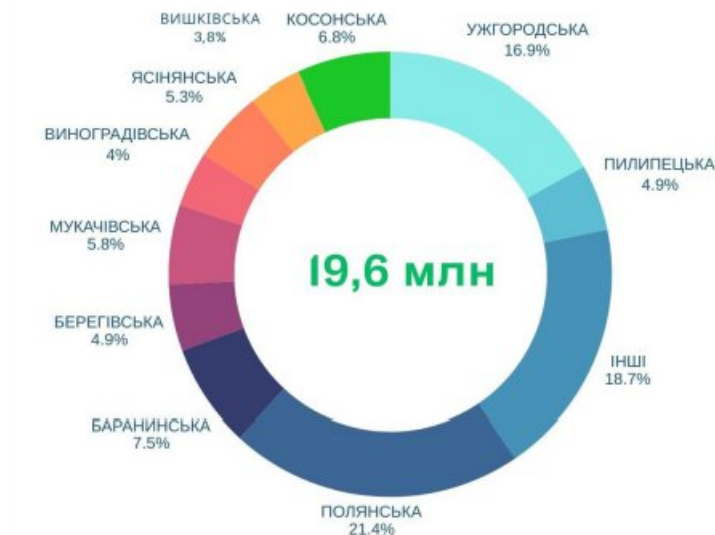
Рис. 3.1. Туристичний збір протягом січень – серпень 2025 року [63]

Туристичний збір, сплачений фізичними особами, становить 11,4 млн грн, а збір, сплачений юридичними особами – 8,1 млн грн, інформує Управління туризму та курортів Закарпатської обласної військової адміністрації.