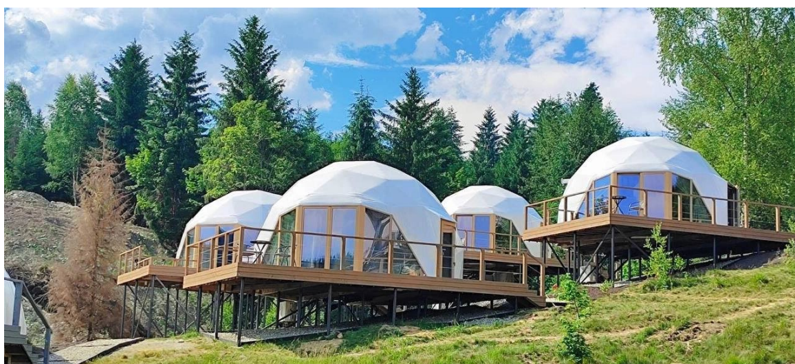
Рисунок 1.2 – Глемпінг в Україні, Буковель

повномасштабної військової агресії. Водночас навіть за таких умов галузь демонструє адаптивність і прагнення до оновлення. Традиційні курортні центри, зокрема Трускавець, Моршин, Східниця, Буковель поступово модернізують інфраструктуру, впроваджують нові стандарти обслуговування та розширюють спектр послуг відповідно до міжнародних вимог. Особливий акцент робиться на розвитку рекреації в безпечних регіонах, насамперед у Карпатах, де активно розвиваються еко-готелі, глемпінги (рис.1.2) та оздоровчі комплекси на основі природних ресурсів [38].