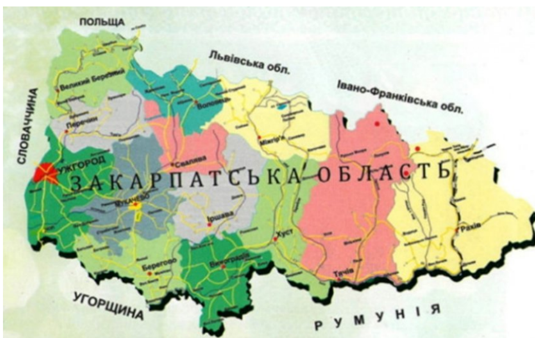
Рисунок 2.1 – Закарпатська область

регіон захищений Карпатським хребтом, на північному заході простягаються Татри, а з південного боку – відроги Західних Румунських гір та Мараморошський гірський масив. Така конфігурація природних бар'єрів створює своєрідну природну замкненість області, водночас забезпечуючи сприятливі умови для розвитку рекреації, туризму, лісового та гірського господарства [30].