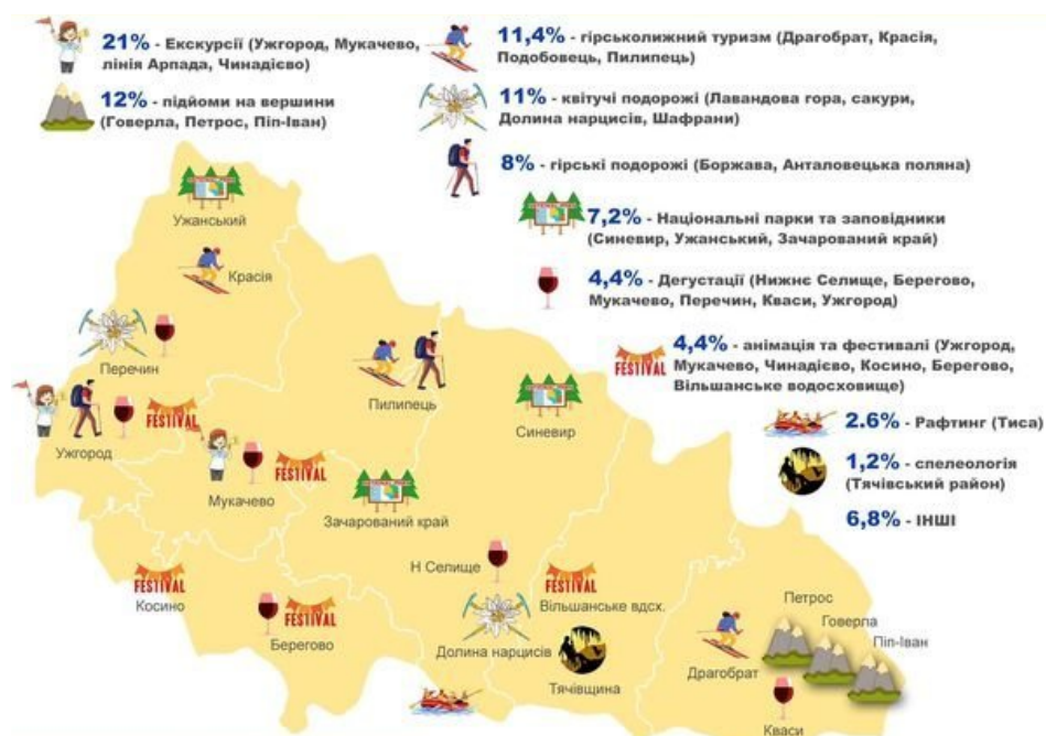
Рисунок 2.4 – Візуалізація розподілу різновидів рекреаційного туризму в Закарпатській області

нарцисів та Шафранка. Ці об'єкти поєднують природну красу та фотогенічність, що робить їх популярними серед молоді в епоху Instagram і TikTok.