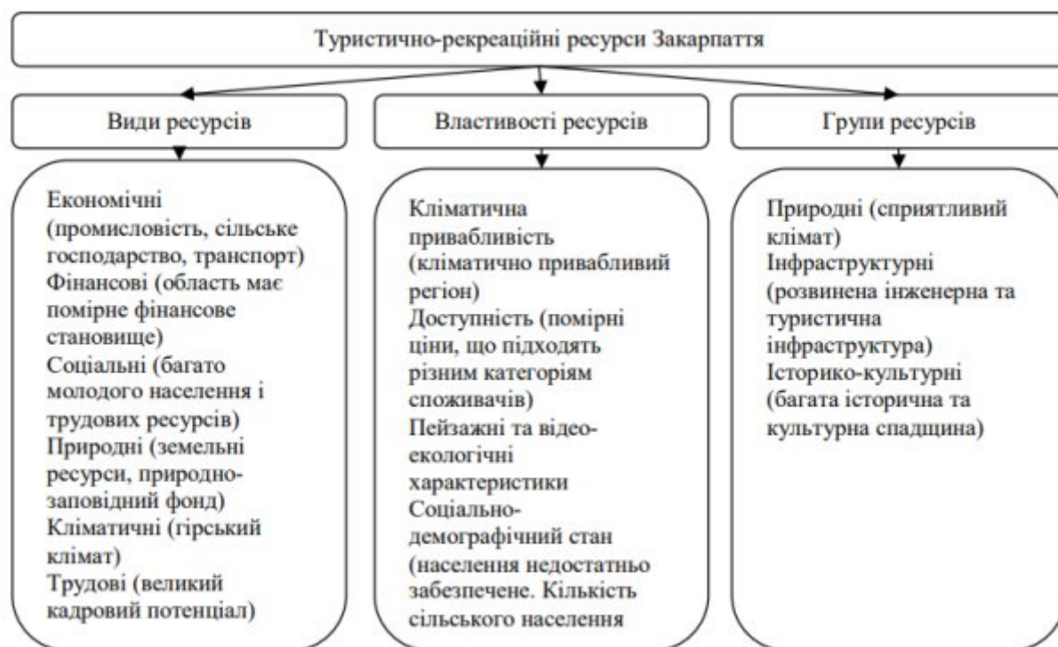
Рисунок 2.2 – Туристично-рекреаційні ресурси Закарпаття

осіб. Хоча цей показник був на 21% нижчим, ніж у 2023 році, зменшення зумовлювалося загальнодержавними безпековими та логістичними обмеженнями, а не втратою інтересу до регіону. Особливе значення має Карпатський біосферний заповідник, який включено до мережі об'єктів ЮНЕСКО. Його праліси, гірські хребти та унікальні екосистеми створюють передумови для розвитку сталого та зеленого туризму. Після 2022 року в регіоні активізувалися локальні ініціативи, спрямовані на поєднання охорони природи та туристичної діяльності, зокрема створення екоферм і проєктів органічного землеробства, які сприяють відродженню сільських територій [32].