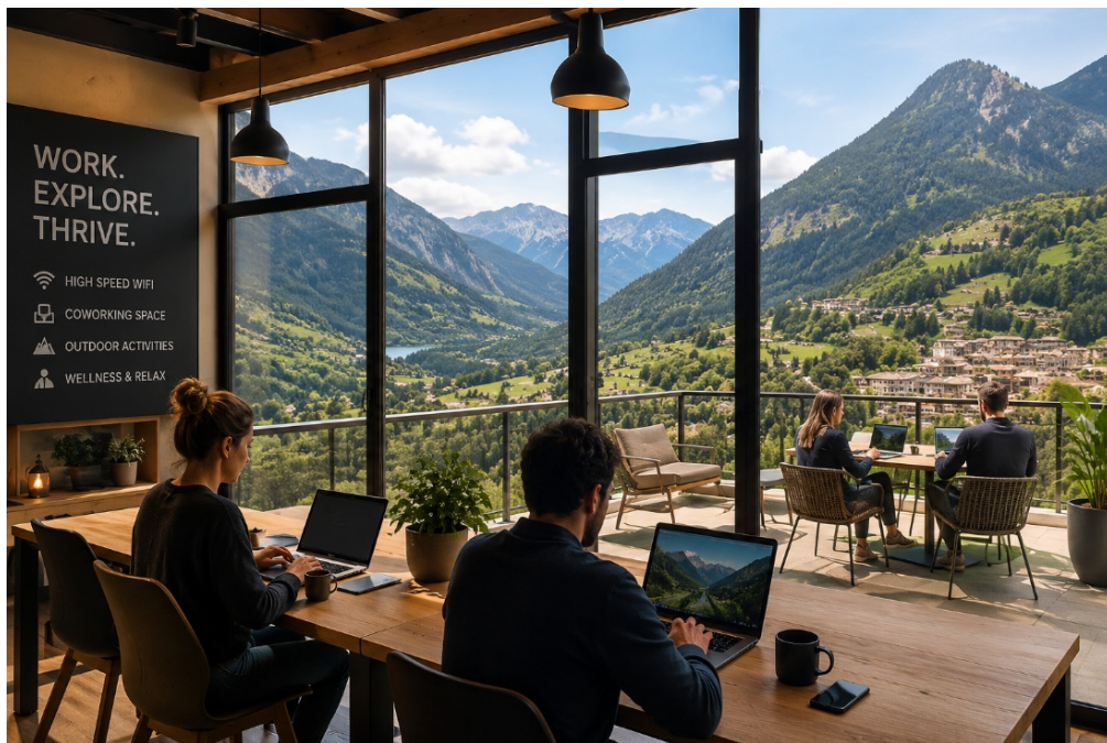
Рисунок 1. 1 – Сучасний простір для дистанційної роботи та рекреаційного відпочинку в гірському туристичному комплексі

Паралельно з цим формується попит на багатофункціональні рекреаційні простори, які поєднують відпочинок із роботою, навчанням і культурною взаємодією (рис. 1.1). Особливої популярності набув формат workation , який передбачає поєднання дистанційної роботи та перебування в рекреаційному середовищі.