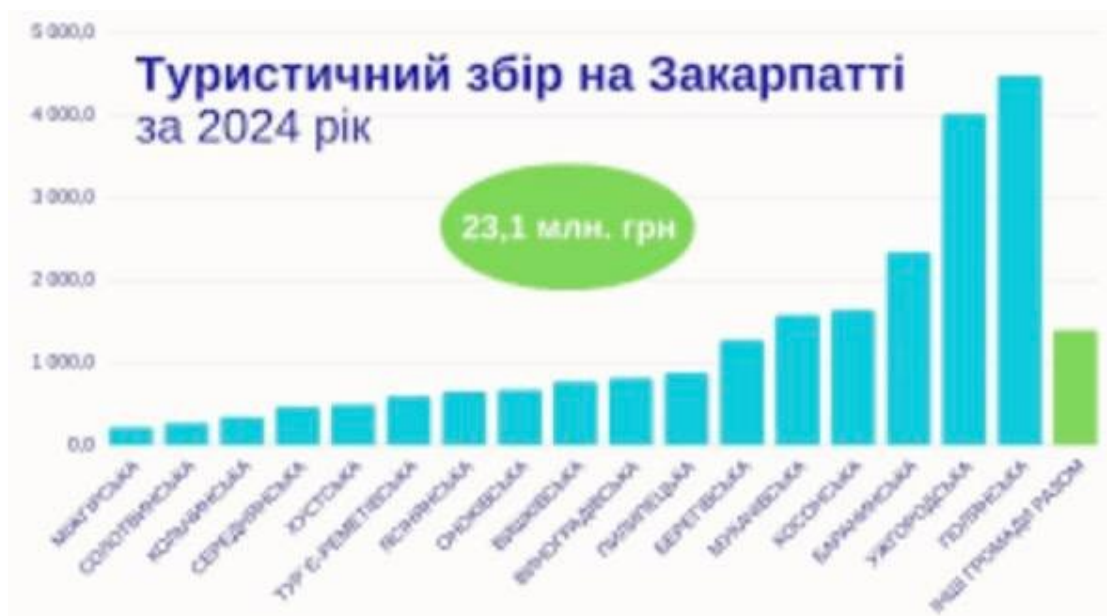
Рис. 2.3 Туристичний збір на Закарпатті за 2024 рік [62]

надходженнями стало село Поляна, яке поповнило місцевий бюджет майже на 4,5 млн грн. Високі показники зафіксовано й в обласному центрі Ужгороді, де сума туристичного збору склала близько 4 млн грн. До трійки лідерів також увійшло село Баранинці з показником 2,3 млн грн [44].