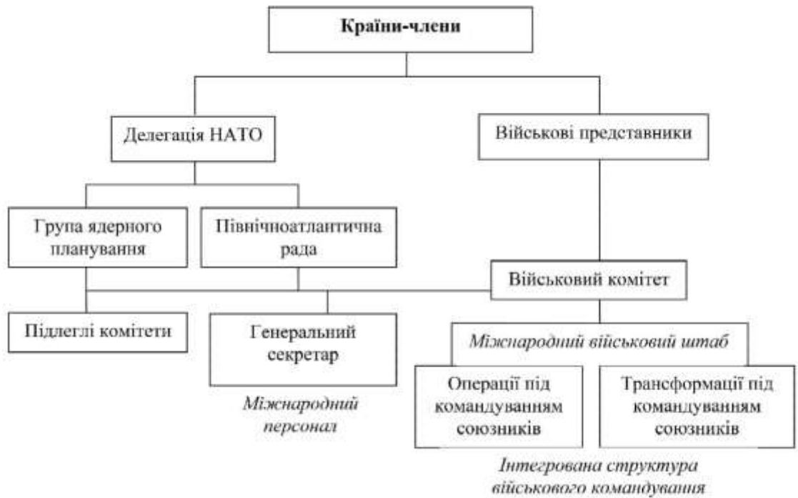
Рис.1.1. Сучасна структура Альянсу 35

Наведена на рисунку організаційна структура НАТО має подальший поділ на спеціалізовані підрозділи та комітети, які забезпечують комплексний процес надання консультацій і сприяння співпраці між державами-членами в політичній, військовій, економічній, науковій та інших сферах. Така розгалужена система сприяє підтримці рівної безпеки для кожної держави, незалежно від їхніх внутрішніх особливостей, відмінностей у способах управління та військовому потенціалі. Унаслідок цього кожна країна-учасниця відчуває себе захищеною, що загалом зміцнює стабільність у Європі.