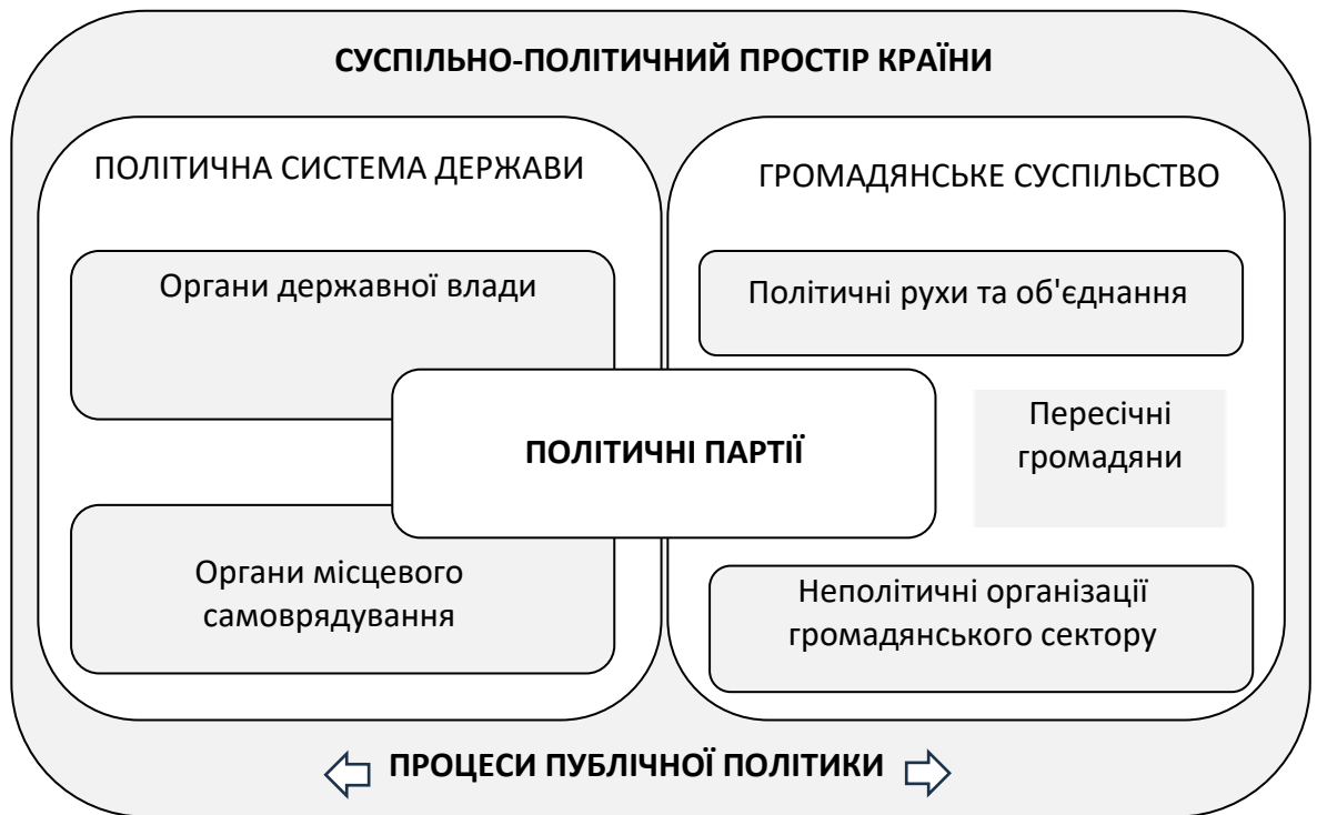
Рис. 1.3. Місце політичних партій у системі владно-суспільних відносин

У системі відносин між владою та суспільством політичні партії виступають певним буфером, що, з одного боку, є частиною суспільства, з іншого – елементом влади, а також – інструментом впливу суспільства на владу (Рис. 1.3).