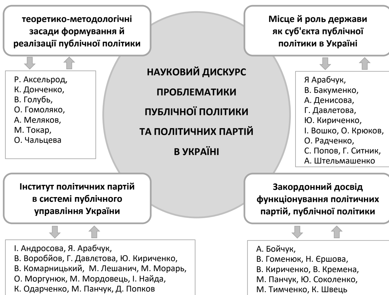
Рис. 1.1. Систематизація наукових підходів проблематики публічної політики та політичних партій в українському дискурсному просторі

публікацій, в тому числі понад 450 дисертаційних досліджень та близько 750 наукових статей в фахових українських виданнях; водночас за хеш-тегом "публічна політика" – близько 300 наукових публікацій та 160 авторефератів дисертацій. Оскільки описати увесь зазначений масив в рамках магістерської роботи неможливо, для нашого джерелознавчого аналізу ми обрали переважно публікації останніх 3–5 років, які в найбільшому узагальненні систематизували за ознаками основної тематичної спрямованості з позицій того чи іншого наукового підходу в 4 наступні групи (Рис. 1.1).