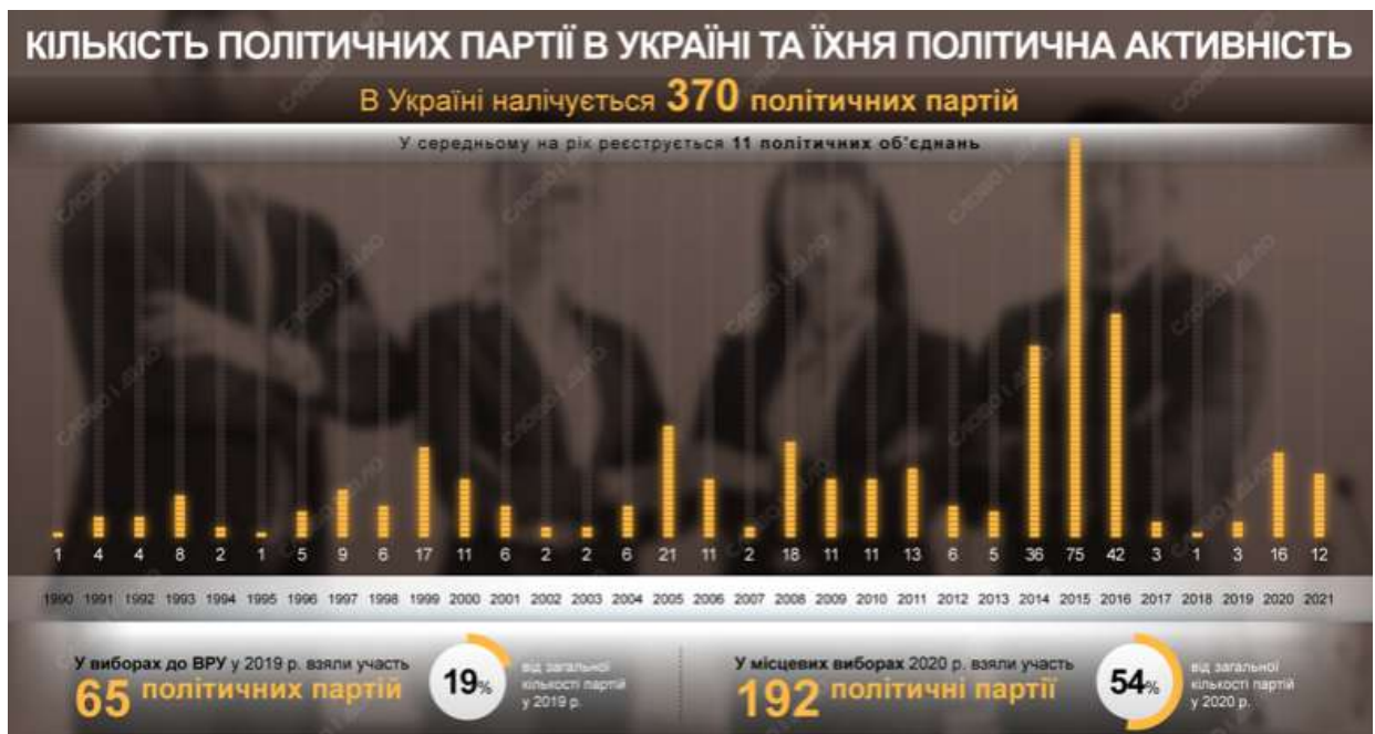
Рис. 1.1 – Кількість політичних партій на 1 січня 2022 р. 21

а на 1 січня 2022 року – 370 партій (рис. 1.1). Постановою Кабінету Міністрів України «Деякі питання державної реєстрації та функціонування єдиних та державних реєстрів, держателем яких є Міністерство юстиції, в умовах воєнного стану» визначено, що документи для державної реєстрації створення політичних партій, змін до відомостей про політичні партії та їх структурні утворення, щодо яких Радою національної безпеки та оборони України прийнято рішення про призупинення діяльності, а також змін до відомостей про політичні партії та їх структурні утворення, щодо яких Міністерством юстиції подано позов про заборону політичної партії, не приймаються, а розгляд раніше поданих документів зупиняється на час дії воєнного стану 20 .