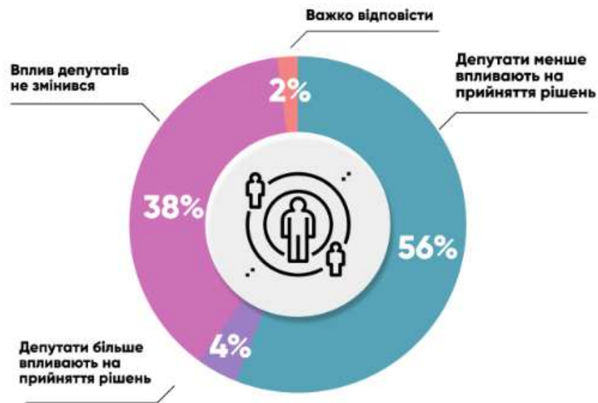
Рис. 2.1 – Відповідь на питання: «Чи змінився вплив депутатського корпусу на прийняття рішень міською радою?» 43

Отже, на початку війни ні українське законодавство, ні інституційна система не були готові оперативно реагувати на наявні виклики у сфері політичної свободи громадян, насамперед – діяльності політичних партій. Це спонукало органи влади гнучко ухвалювати рішення. Зокрема, були прийняті закони, які забороняли діяльність політичних об'єднань, програма та дії яких спрямовувалися на виправдовування російської агресії. Крім того, були