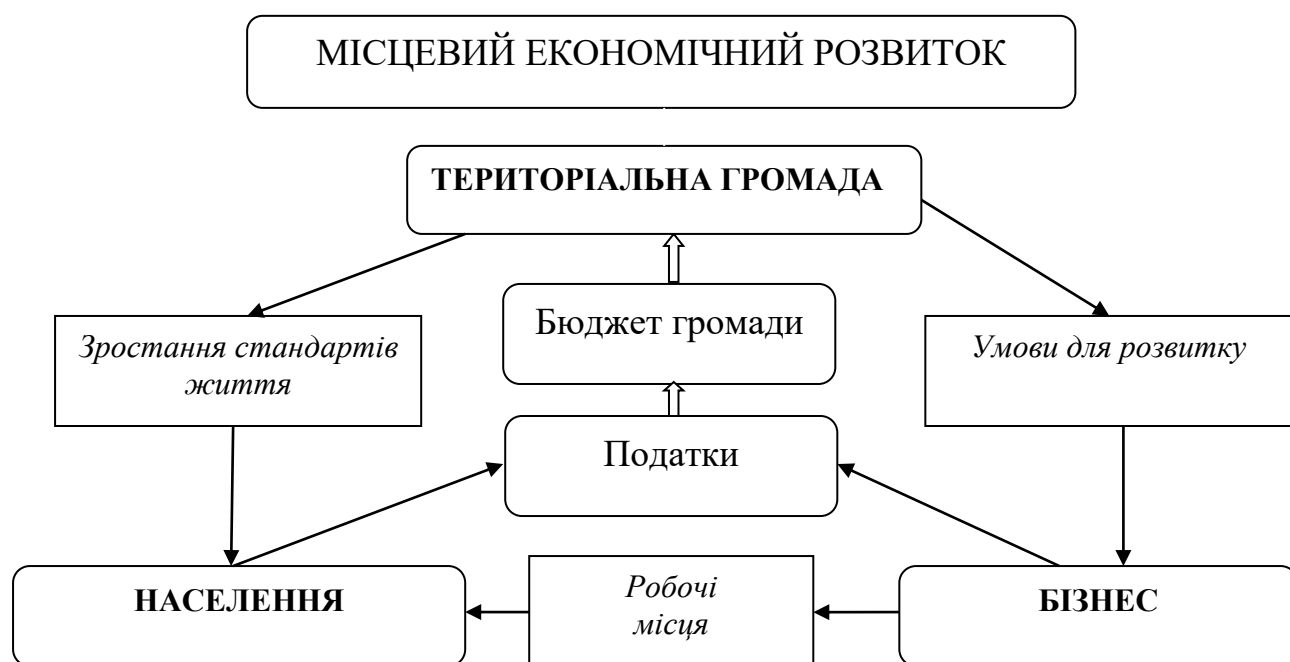
Рис.1.2 - Суб'єкти забезпечення місцевого економічного розвитку та конкурентоспроможності території

Громада-населення-бізнес-структури є важливими суб'єктами забезпечення місцевого економічного розвитку та конкурентоспроможності території (рис. 1.2).