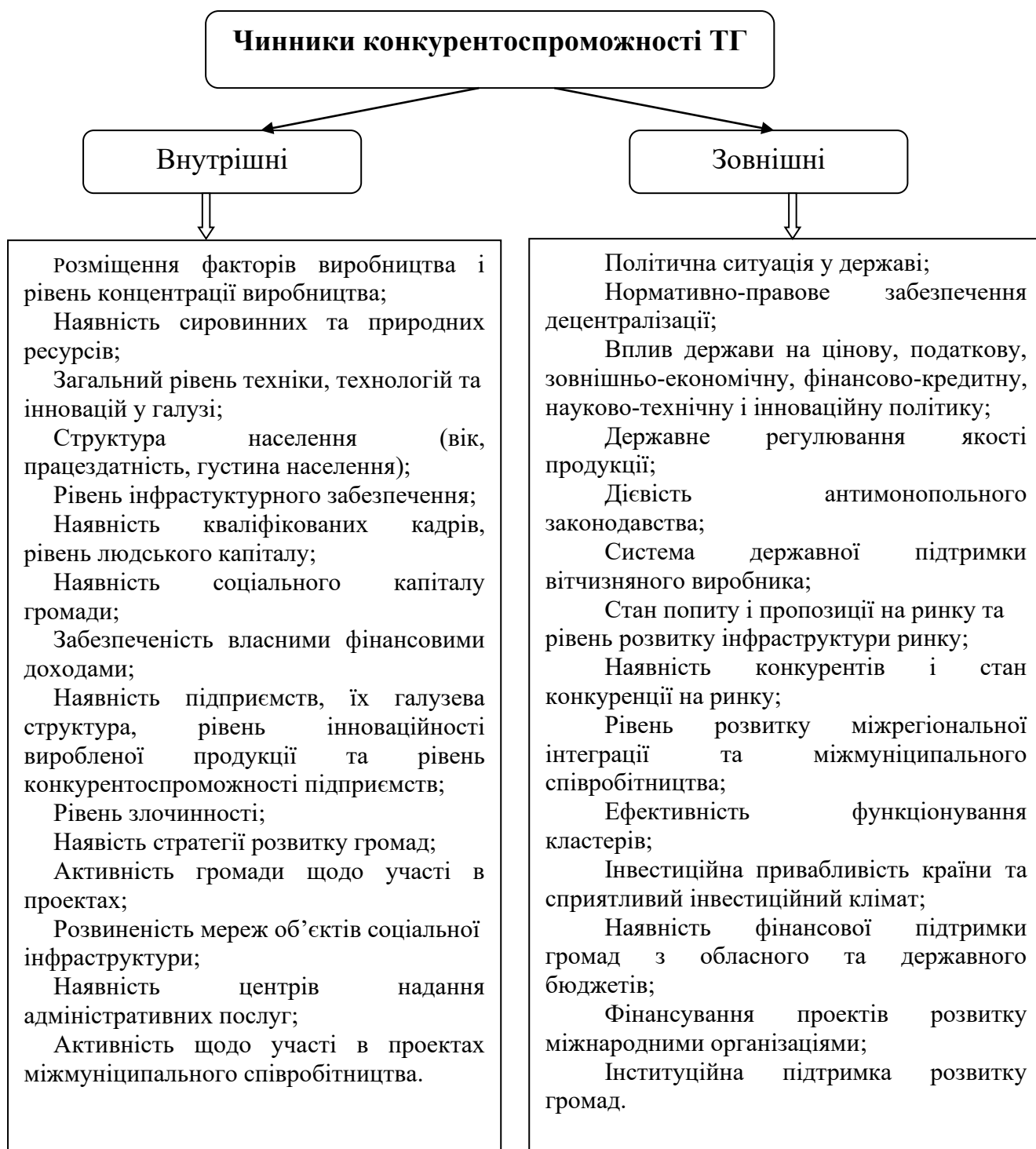
Рис. 2.1 - Чинники конкурентоспроможності територіальних громад