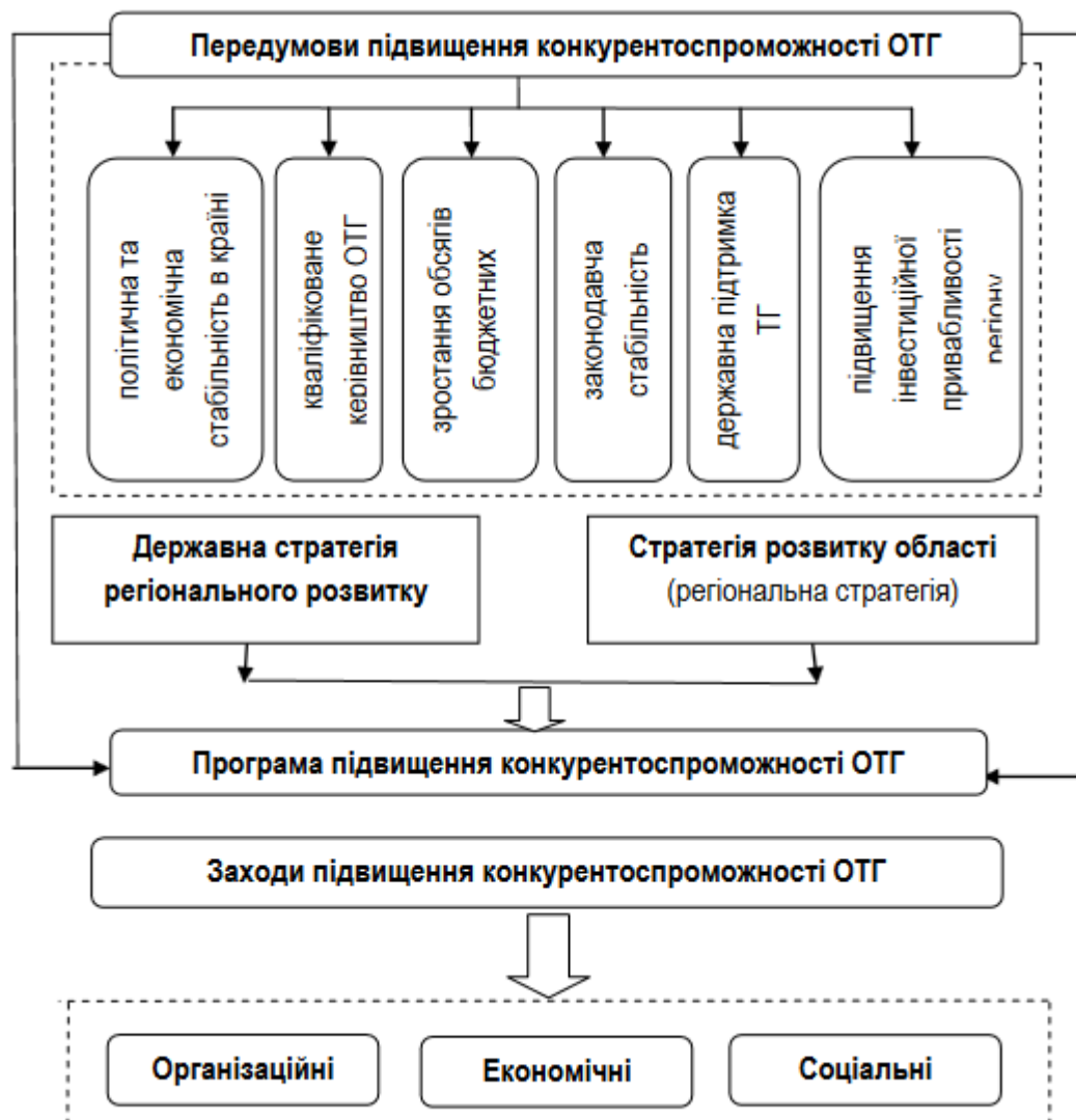
Рис.3.1 - Передумови підвищення конкурентоспроможності територіальних громад

Цілі та мета програми обов'язково повинні базуватись на врахуванні зовнішніх передумов та внутрішнього потенціалу розвитку певної територіальної громади (3.1).