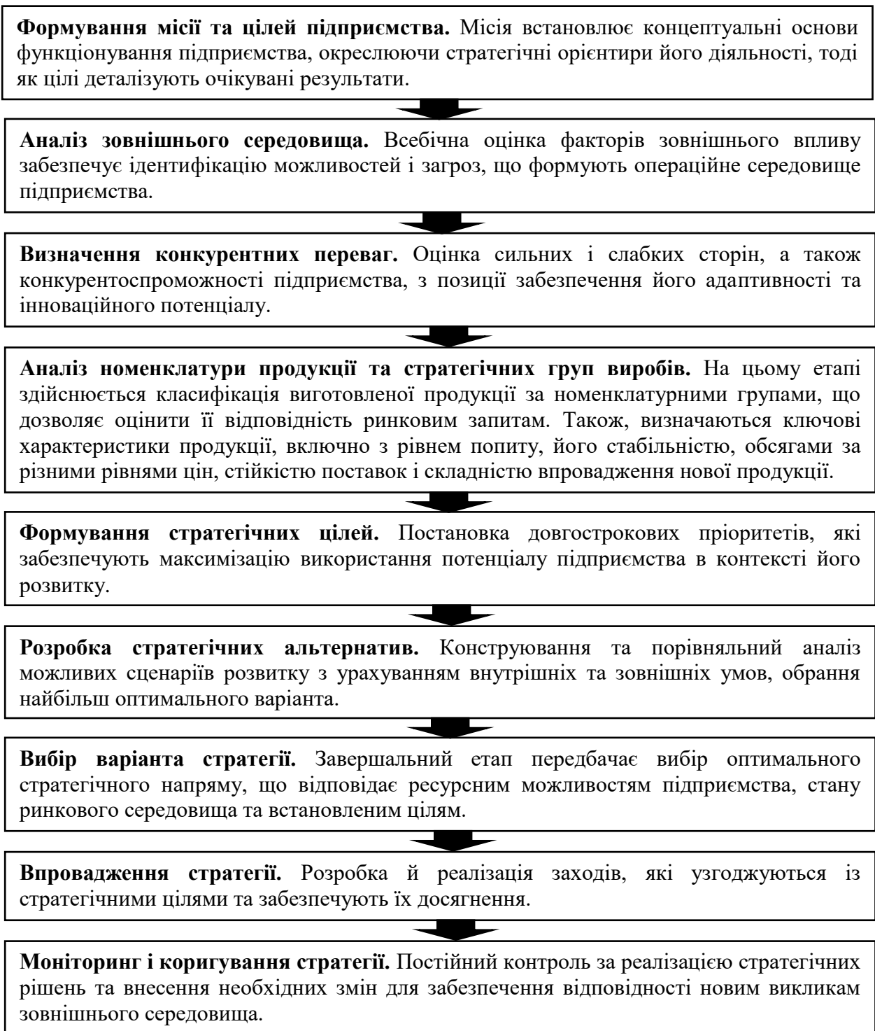
Рисунок 1.1. – Основні етапи процесу формування стратегії розвитку фермерських підприємств