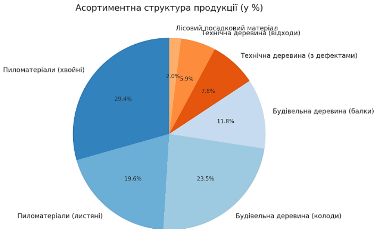
Рисунок 2.1 - Структура асортименту продукції у відсотковому співвідношенні