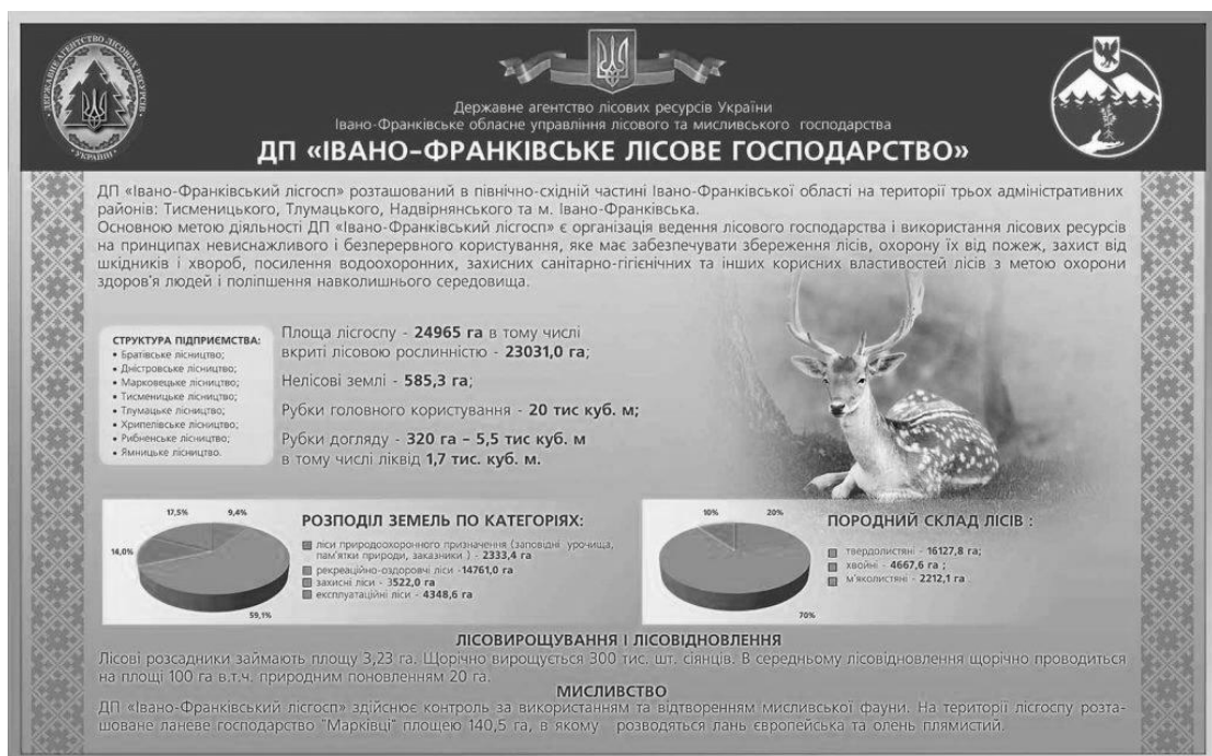
Рис.2.1 Апарат управління

Підприємство здійснює безперервне і невиснажливе використання лісових ресурсів, яке включає планомірне задоволення потреб виробництва та населення в деревині та іншій лісовій продукції, поліпшення породного складу та якості лісів, а також підвищення їх продуктивності (рис.2.1).