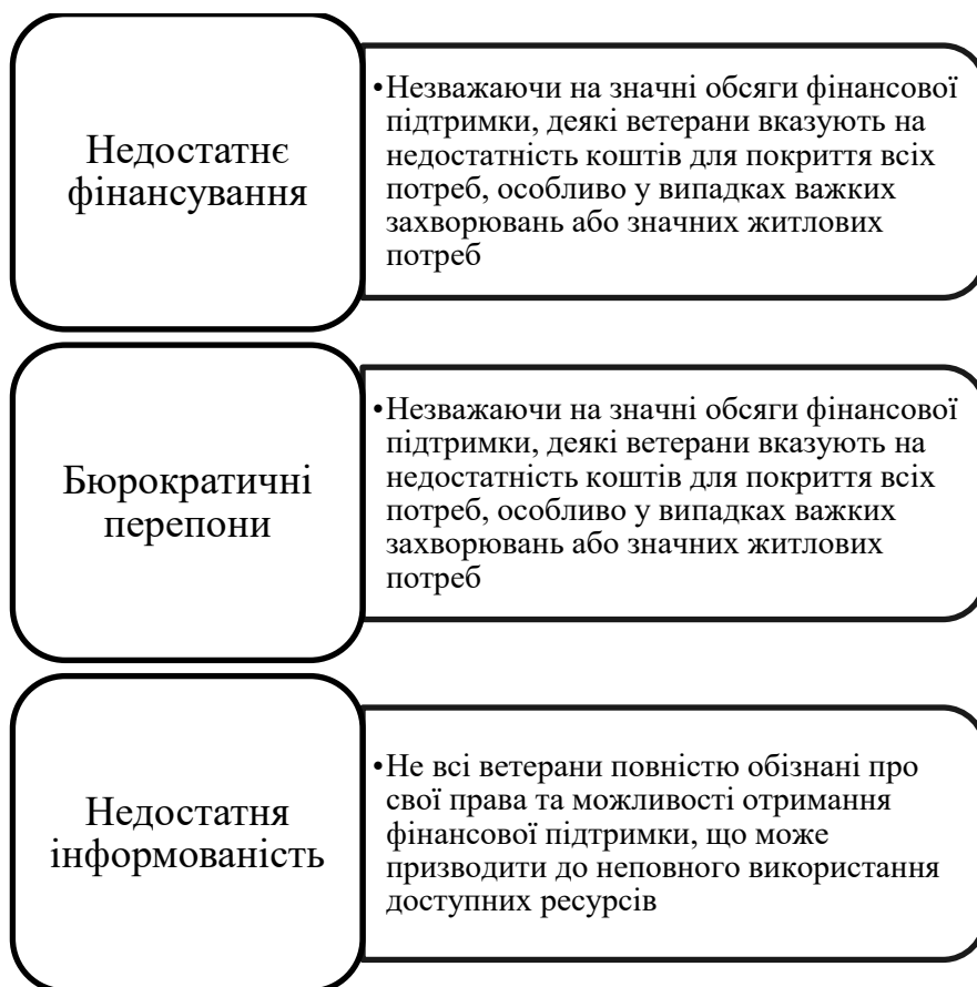
Рис. 2.2 – Основні проблеми та виклики, що виникають в процесі здійснення фінансової підтримки ветеранів в рамках обласної програми Івано-Франківської ОДА

Для покращення ефективності фінансової підтримки рекомендується: