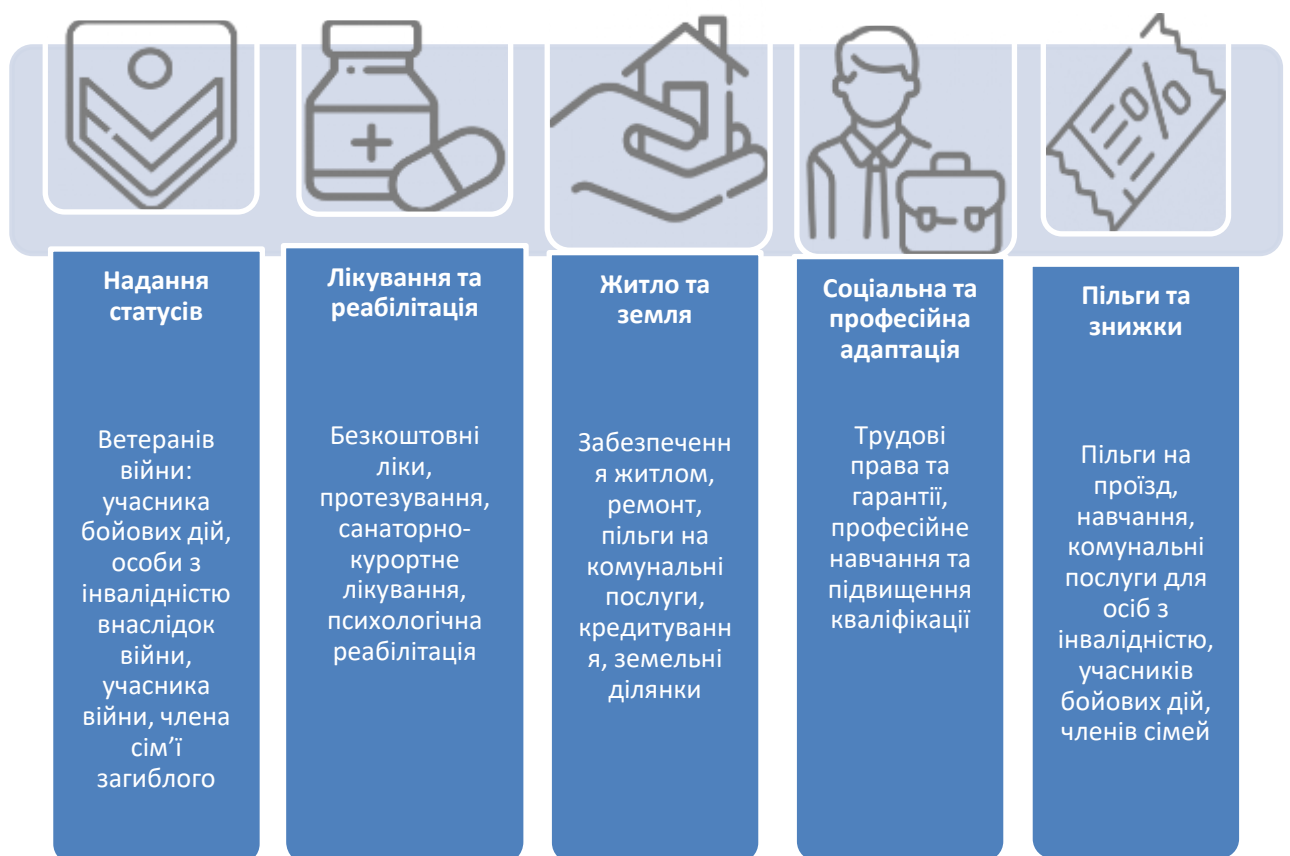
Рис. 2.1 – Аналіз рубрики «Ветеранам». Сайт Міністерства у справах

Аналіз досягнень у сфері соціальної реабілітації учасників бойових дій в Україні розпочнемо з аналізу змістового наповнення сайту Міністерства у справах ветеранів – рубрика «Ветерани» (рис. 2.1).