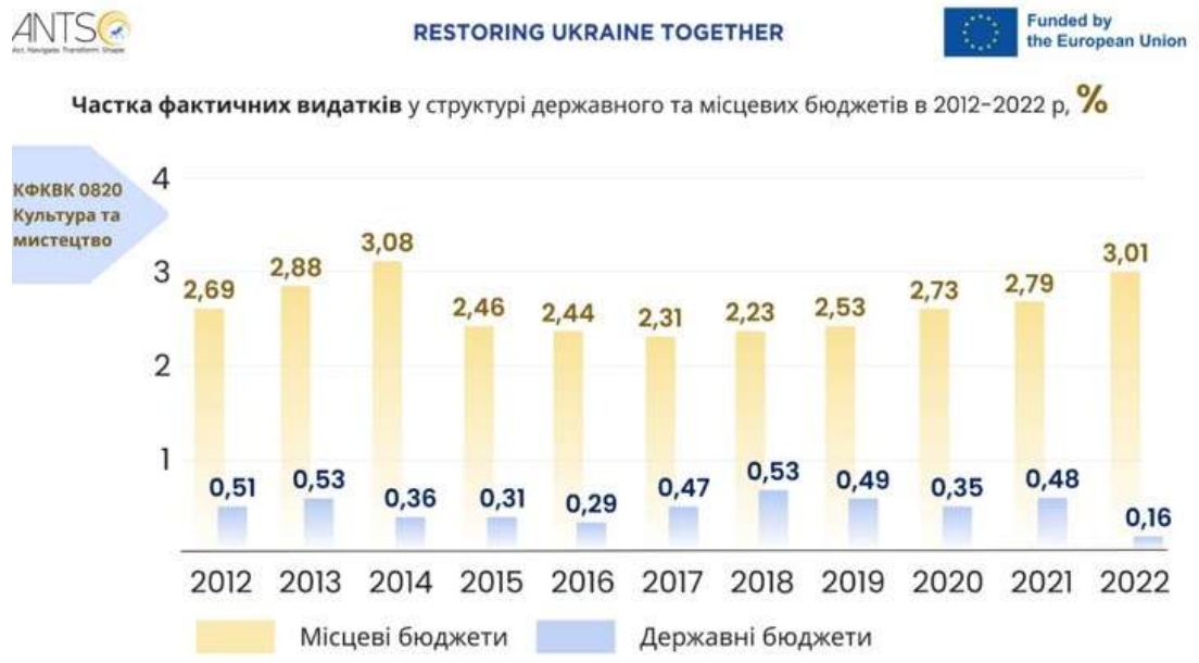
Рис. 2.1 Частка фактичних видатків на сферу культури та мистецтва у структурі державного та місцевих бюджетів в 2012-2022 рр, % 55

області номінально збільшили видатки на культуру на 1-5% у гривні, інфляція «з'їла» незначне зростання.