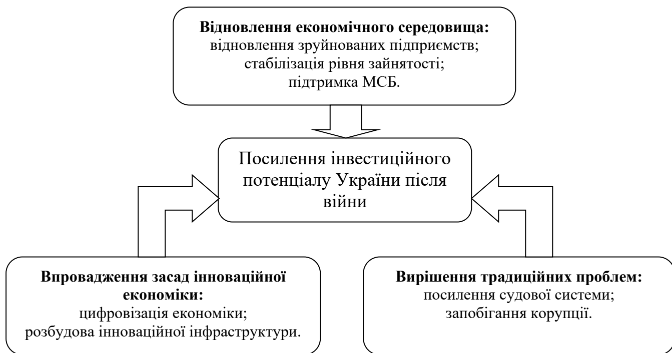
Рис.3.2 - Модель посилення інвестиційного потенціалу України після війни

Так, враховуючи всі вищезазначені бар'єри ефективного формування та реалізації інвестиційного потенціалу України було розроблено ряд заходів щодо його посилення з урахуванням наслідків російсько-української війни наряду з можливостями для впровадження інноваційних технологій у промисловому секторі. Зобразимо модель посилення інвестиційного потенціалу України після війни на рис.3.2.