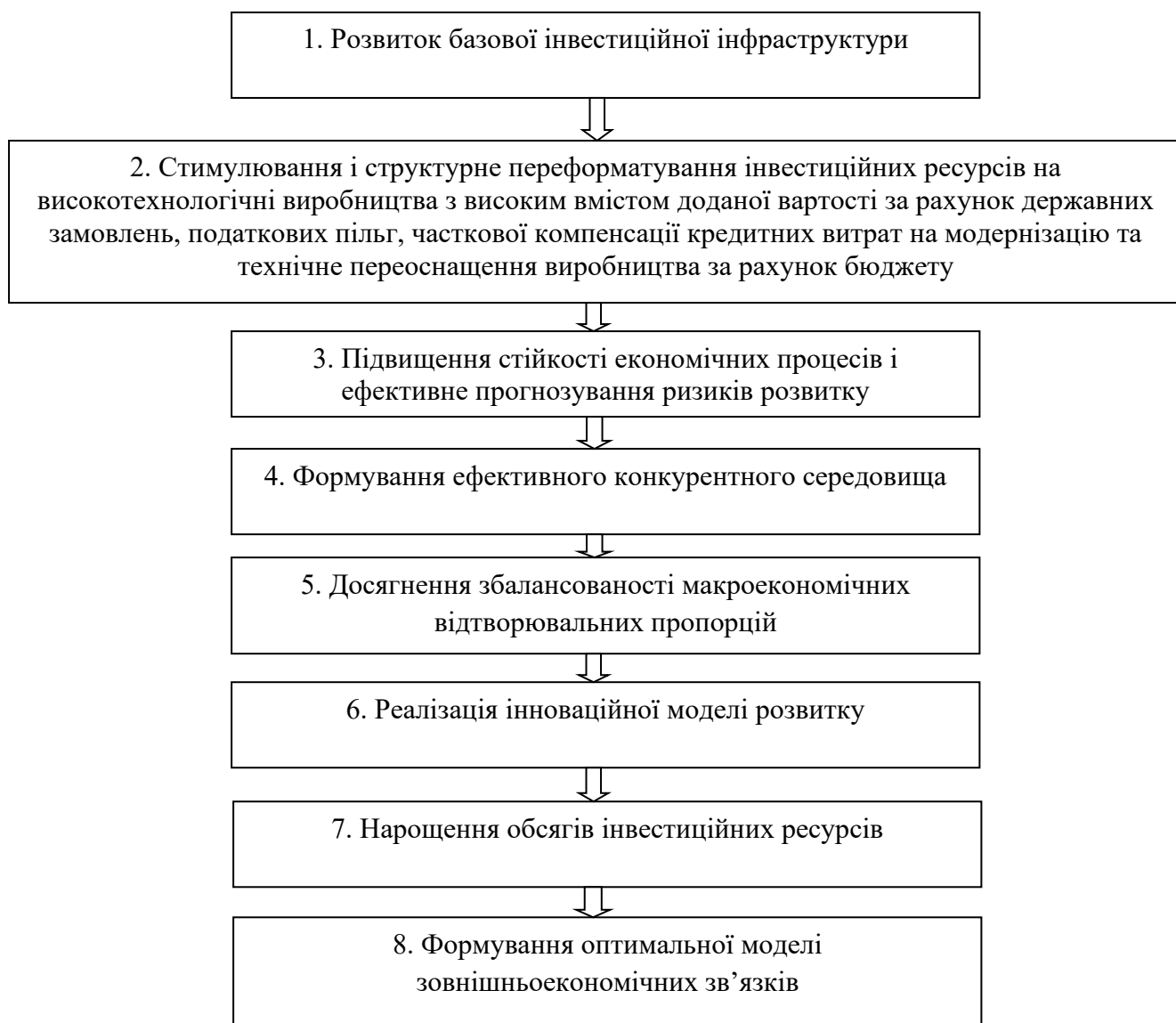
Рис. 3.1 – Основні засади механізму формування інвестиційного потенціалу національної економіки та управління ним

інвестиційним потенціалом на національному рівні в період відбудовчих трансформацій.