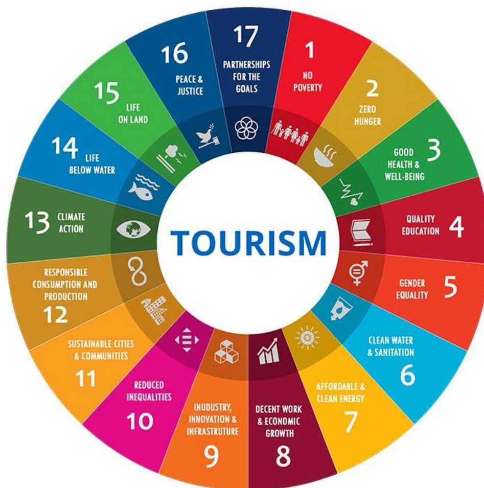
Рис.1.1. Інтерпретація ЦСР для потреб туристичної галузі [24]

Протягом 1990-х років була ухвалена низка міжнародних документів, що стосуються сталого розвитку туризму. Зокрема, Міжнародна конференція з туризму, яка відбулася у Ланшеро (Канарські острови) в 1995 році, ухвалила «Хартію зі сталого туризму» [25]. У квітні 1999 року рішенням Генеральної Асамблеї та Комісії зі сталого розвитку ООН була ухвалена «Міжнародна програма зі сталого розвитку туризму» [26]. У тому ж році у Сантьяго (Чилі) був ухвалений «Глобальний етичний кодекс туризму» [27]. У цьому документі викладено комплекс орієнтирів для відповідального і сталого розвитку туризму у новому тисячолітті. Кодекс наголошує на демократичному, ліберальному характері туристського руху, який здійснюється завдяки прямим контактам людей у дусі толерантності та поваги до різноманітних релігійних, філософських і моральних переконань.