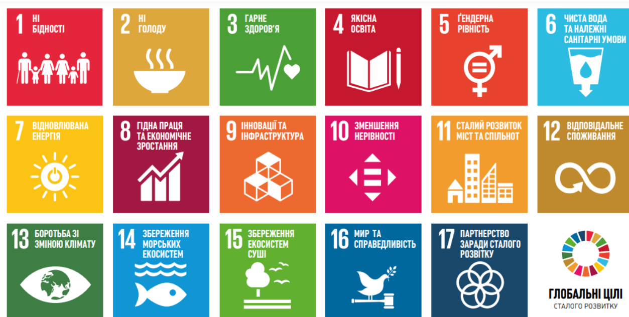
Рис.1.3. ЦСР для України

Успіхи у досягненні ЦСР значною мірою залежатимуть від того, наскільки ЦСР та відповідні завдання та індикатори будуть інтегровані у систему стратегічного планування на національному та регіональному рівнях. Враховуючи це, Програма розвитку ООН ініціювала інклюзивний процес розробки Стратегії сталого розвитку для України на період до 2030 року. Передбачається, що Стратегія слугуватиме інструментом реалізації ЦСР та буде рамковим документом, який спрямовуватиме стратегічне планування у різних секторах національного розвитку.