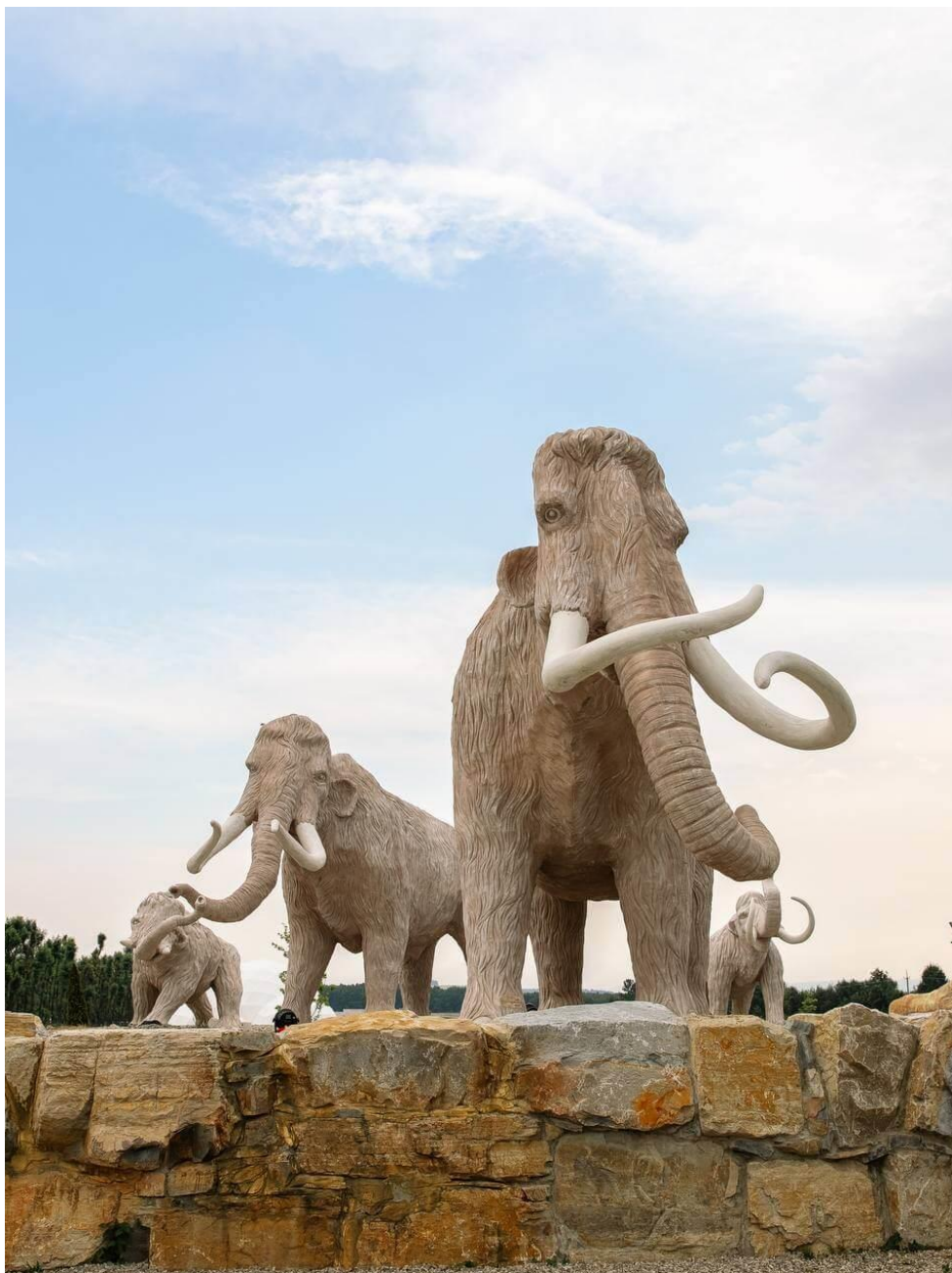
Рис.2.5. Скульптурний ансамбль «Сім'я мамонтів»

Парк виконує важливу освітню функцію, забезпечуючи доступ до знань про прадавні епохи та доісторичних тварин. Інтерактивні експонати та пізнавальні зони сприяють формуванню у відвідувачів глибшого розуміння історії Землі та її біологічного різноманіття. Завдяки інтеграції новітніх технологій та сучасних наукових даних, парк забезпечує ефективний і захоплюючий спосіб навчання, що стимулює інтерес до науки та історії серед відвідувачів різного віку.