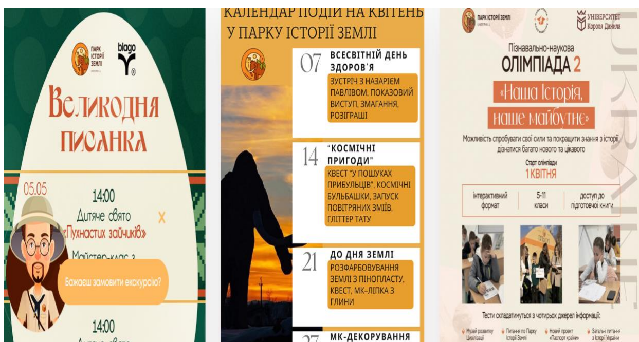
Рис.2.6. Організація різноманітних подій в парку [39]

Підтримка таких ініціатив є важливою складовою розвитку науково-освітнього туризму в Україні. Парк слугує прикладом успішного поєднання мистецтва, науки та бізнесу, що сприяє формуванню позитивного іміджу країни на міжнародній арені та залученню туристів з усього світу (рис.2.6).