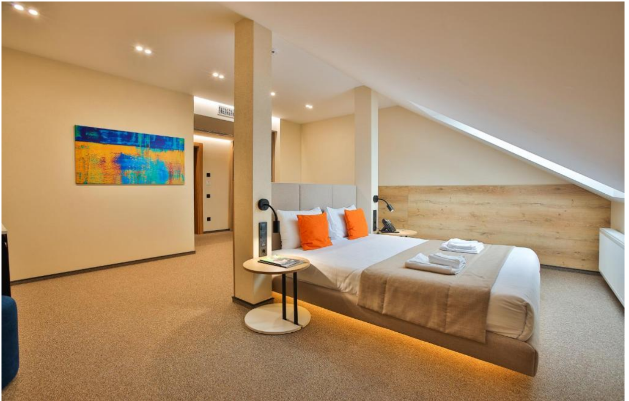
Рис.2.3. Номер Люкс

Для гостей, які шукають максимальний комфорт, готель пропонує номери-студію площею від 37 до 47 квадратних метрів. У таких номерах є одне особливо широке двоспальне ліжко, а також балкон, звідки відкривається чудовий краєвид. Деякі номери-студію також обладнані диван-ліжком, що дозволяє розмістити до чотирьох гостей. Вартість проживання у номері-студію становить від 11700 до 17700 гривень за три ночі, включаючи податки та збори [40].