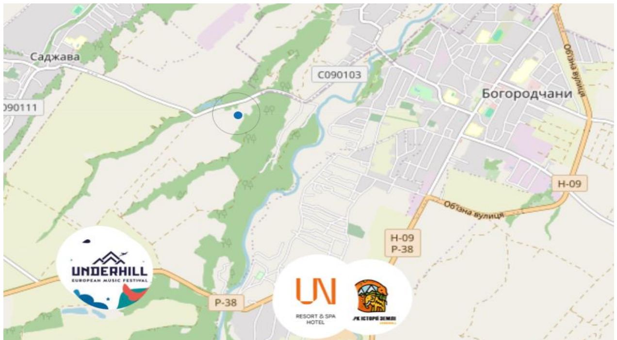
Рис.2.4. Розташування Парк історії Землі «Underhill»

Парк історії Землі «Underhill» — перший в Україні відкритий тематичний парк — музей, орієнтований на активний відпочинок у різноманітних пізнавально-розважальних напрямках. На локаціях відвідувачі завдяки різним форматам взаємодії можуть активно взаємодіяти в умовах різноманітних історично-природних епох Землі. Також на території парку проводяться щотижневі заходи, які допомагають відвідувачам пізнати українську автентичну культуру та звичаї. Розташований у селі Підгір'я Богородчанського району Івано-Франківської області (рис.2.4) [30].