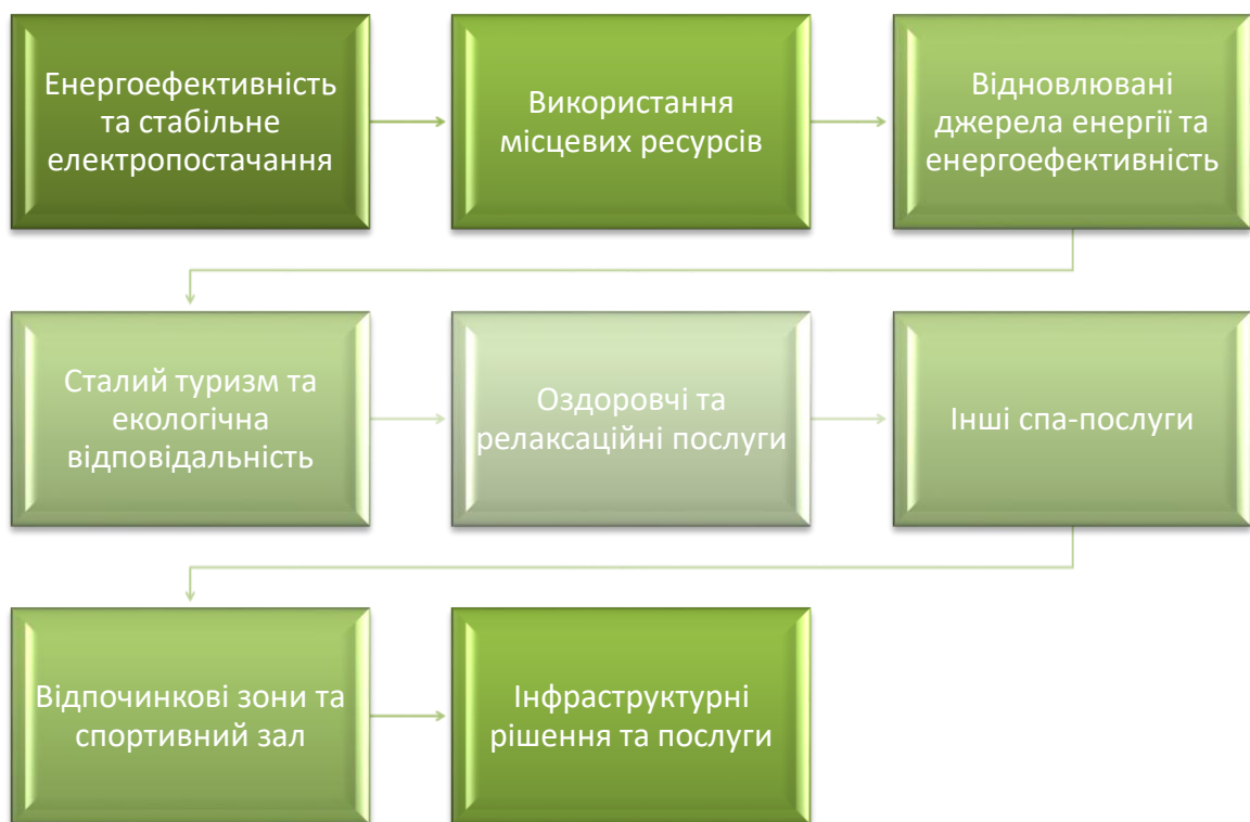
Рис.2.7. Стратегія впровадження принципів сталого розвитку у діяльність відпочинкового комплексу «Underhill Resort Spa Hotel»

Курортний спа-готель Underhill активно реалізує концепцію сталого розвитку через впровадження різних екологічно відповідальних та енергоефективних заходів. Розглянемо детальніше ключові аспекти цієї стратегії. (рис2.7).