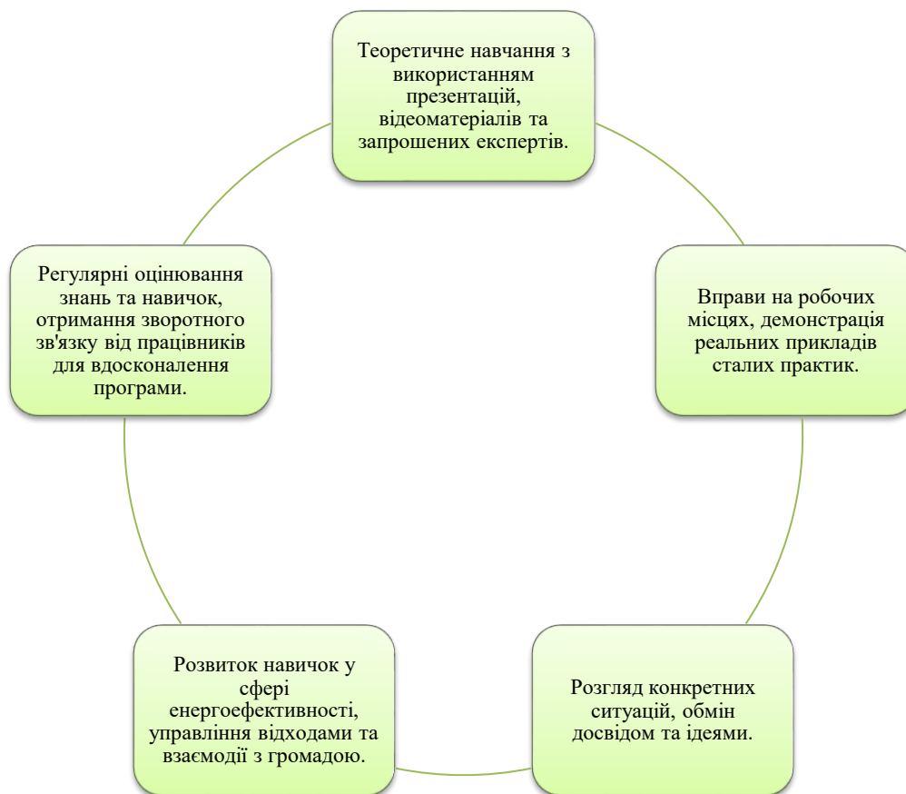
Рис.3.2. Методи навчання персоналу

У таблиці 3.1. відображено програму навчання (таб.3.1).