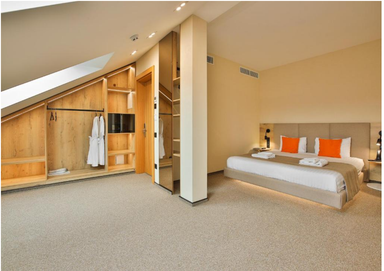
Рис.2.2. Двомісний номер «Underhill Resort Spa Hotel»

Люкси площею від 25 до 35 квадратних метрів пропонують додатковий простір для відпочинку. Вони обладнані одним особливо широким двоспальним ліжком та, у деяких випадках, диван-ліжком.