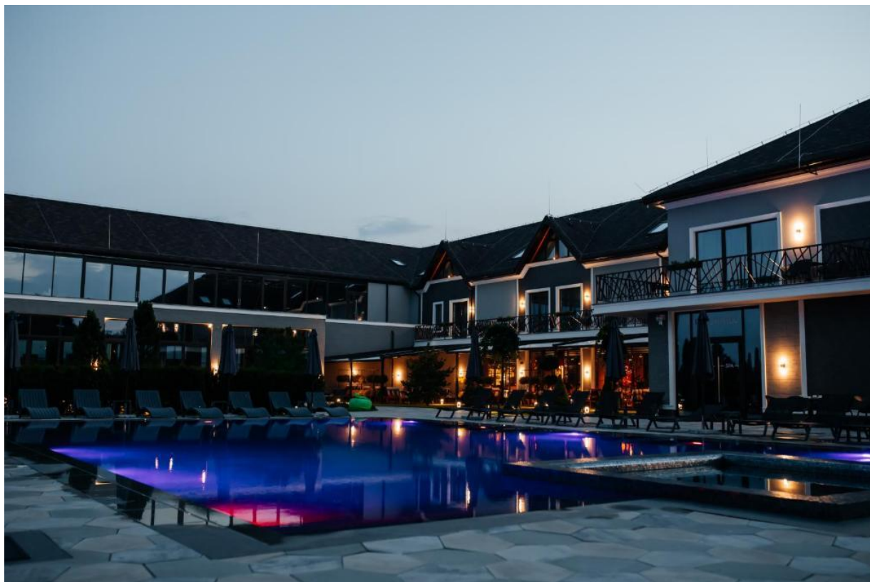
Рис.2.1. Зовнішній вигляд «Underhill Resort Spa Hotel» [38]

Готель пропонує декілька категорій номерів, кожна з яких має свої особливості та переваги. Двомісні номери площею 43 квадратні метри обладнані одним особливо широким двоспальним ліжком, туалетно-косметичними засобами, халатом, ванною або душем, феном, килимовим покриттям, вішалкою для одягу, сушаркою для одягу та туалетним папером. Вартість проживання у такому номері становить 7800 гривень за три ночі, що включає податки та збори, а також сніданок (рис.2.2) [40].