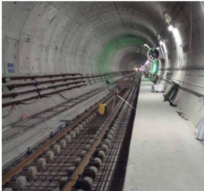
Рис. 3.3 – Будівництво безбаластових колій

Одним із основних завдань є корекція положення колії в абсолютному просторі. Інтегровані системи Trimble забезпечують точне порівняння фактичного положення колії з проектним, автоматично визначаючи необхідні параметри горизонтальної та вертикальної виправки. Це дозволяє здійснювати коригування ще під час виконання робіт, мінімізуючи відхилення і забезпечуючи точність укладання вже на етапі будівництва [22,23].