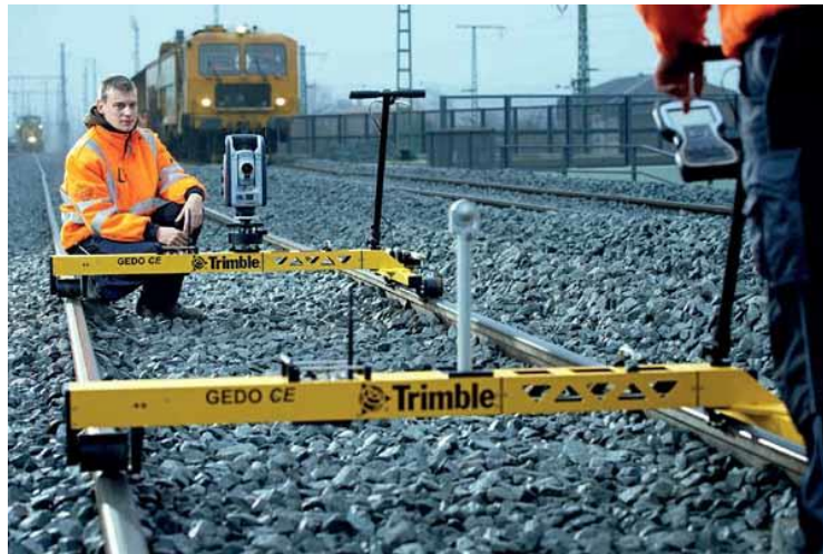
Рис. 3.1 – Шляховимірювальна система Trimble GEDO CE

Шляховимірювальні системи GEDO застосовуються на всіх етапах життєвого циклу залізничної колії. Вони ефективно вирішують низку технічних завдань, зокрема при обслуговуванні (заміна полотна, заміна рейок, підбивання), під час експлуатації (контроль габаритів), а також у процесах нового будівництва — як на суцільній, так і на баластній основі. Окрім того, система використовується для реконструкції високошвидкісних магістралей (ВСМ), внесення нових елементів плану чи профілю та оптимізації існуючих рішень [22,23].