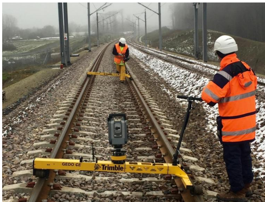
Рис. 3.2 -Ремонт баластової колії

У процесі будівництва безбаластових залізничних колій особливо важливо дотримуватись високої точності монтажу, жорсткої відповідності проєктним параметрам і контролю геометрії на кожному етапі. Оскільки такі колії не передбачають використання баласту для компенсації відхилень, будь-які помилки можуть призвести до серйозних експлуатаційних проблем. Сучасні цифрові технології, зокрема рішення компанії Trimble, забезпечують комплексний підхід до геодезичного супроводу, дозволяючи точно позиціонувати елементи колії, здійснювати контроль укладання в режимі реального часу та вести повну документацію з дотриманням найвищих стандартів якості [23,22].