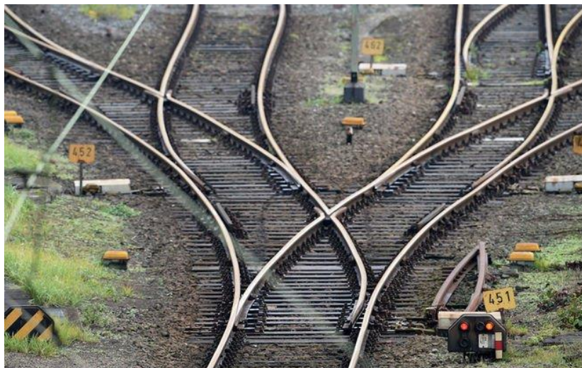
Рис. 1. 3 – Складність просторової геометрії у залізничній галузі

Залізнична галузь характеризується великою протяжністю об'єктів, значною складністю просторової геометрії та високими вимогами до точності розташування елементів. Тому геодезичне забезпечення — невід'ємна складова всіх етапів життєвого циклу інфраструктури: від планування та проектування — до поточного контролю та модернізації [5].