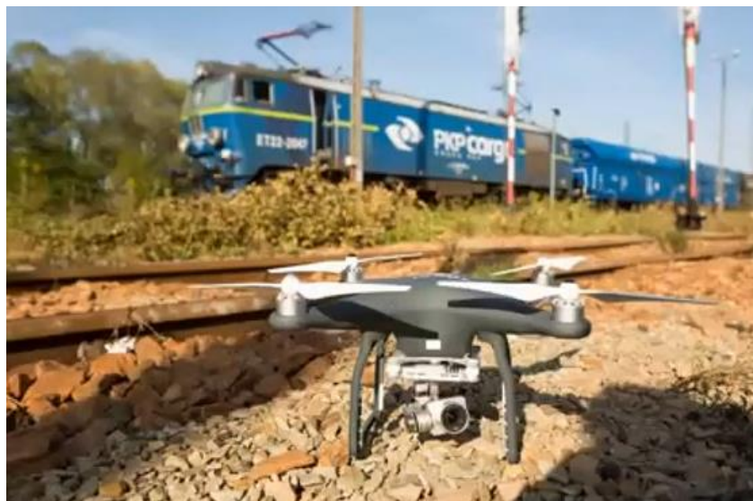
Рис. 1.4 – БПЛА

Застосування сучасних технологій, таких як високоточне GNSS-спостереження, лазерне сканування, безпілотні літальні апарати з фотограмметричним обладнанням, значно розширює можливості геодезії в цьому аспекті. Такі системи можуть не тільки фіксувати просторове положення елементів, а й виявляти тенденції змін, прогнозувати можливі наслідки та дозволяти приймати превентивні інженерні рішення.