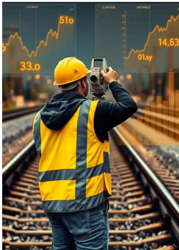
Рис.1.5 – Геодезичний контроль

Геодезичні виміри є основою інженерного контролю. Геодезичні вимірювання в залізничному будівництві та експлуатації використовуються для вирішення таких завдань, як створення геодезичних мереж, розроблення планово-висотної основи, винесення в натуру проєктних рішень, спостереження за деформаціями конструкцій та споруд, контроль технічного стану колії, перевірка вертикальності, горизонтальності та планового розташування елементів інфраструктури. В усіх цих випадках застосування точних вимірювань є критично важливим, оскільки навіть незначні похибки можуть призвести до масштабних технічних і фінансових наслідків. Загалом, у залізничній галузі переважають високоточні геодезичні роботи, особливо на етапах реконструкції колії, модернізації станцій, будівництва мостів, тунелів і шляхопроводів. Геодезист повинен забезпечити точність вимірювань відповідно до встановлених нормативів, таких як ДСТУ, СНіПи, інструкції Укрзалізниці тощо [8,9].