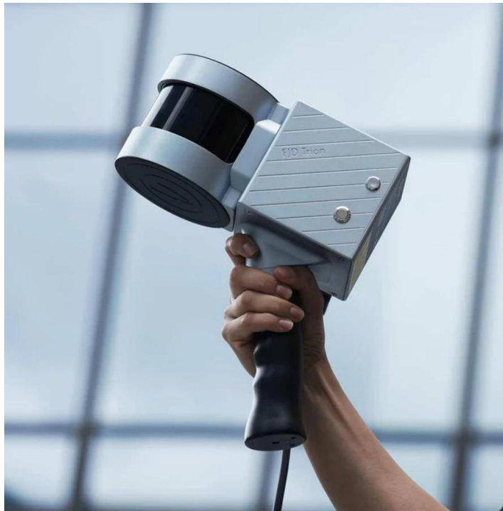
Рис. 2.3 – LiDAR-сканер

Сканування може проводитись у різний спосіб залежно від типу обладнання та завдань: