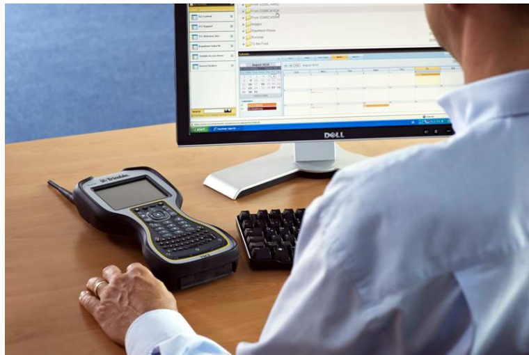
Рис. 3.5 – Офісне програмне забезпечення

Офісне (камеральне) програмне забезпечення — це комплекс програмних засобів, призначених для обробки, аналізу та підготовки остаточних результатів геодезичних і картографічних робіт у стандартних форматах, що використовуються у проектуванні (CAD) та картографії. На відміну від польових рішень, офісне ПЗ працює з уже зібраними даними — інструментальними вимірюваннями, цифровими знімками, даними дистанційного зондування, результатами фотограмметрії та іншими видами просторової інформації. Його головна мета — перетворення первинних («сирих») даних на готові, структуровані продукти, які можна використовувати в інженерних, будівельних, кадастрових, транспортних та інших системах.