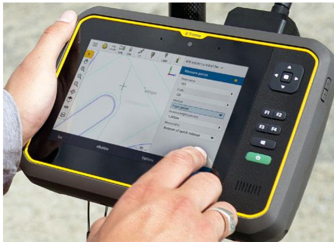
Рис. 3.4 – Польове програмне забезпечення

Польове програмне забезпечення — це спеціалізовані програми, які встановлюються на зовнішні польові пристрої, такі як контролери, планшети чи смартфони, або інтегруються безпосередньо в геодезичні інструменти. Основним його призначенням є забезпечення повноцінної взаємодії з приладами у процесі виконання геодезичних робіт. Таке програмне забезпечення дозволяє керувати інструментом — здійснювати налаштування параметрів, калібрування та виконання вимірювальних або розбивочних команд. У процесі знімальних робіт воно забезпечує збереження результатів вимірювань у пам'яті пристрою, а при виконанні розбивочних робіт — завантаження проектних даних для їх використання безпосередньо в полі. Однією з ключових функцій також є можливість обміну даними з офісним програмним забезпеченням: результати польових вимірювань експортуються для подальшої обробки, а проектна інформація імпортується до приладів для точного позиціонування елементів на місцевості.