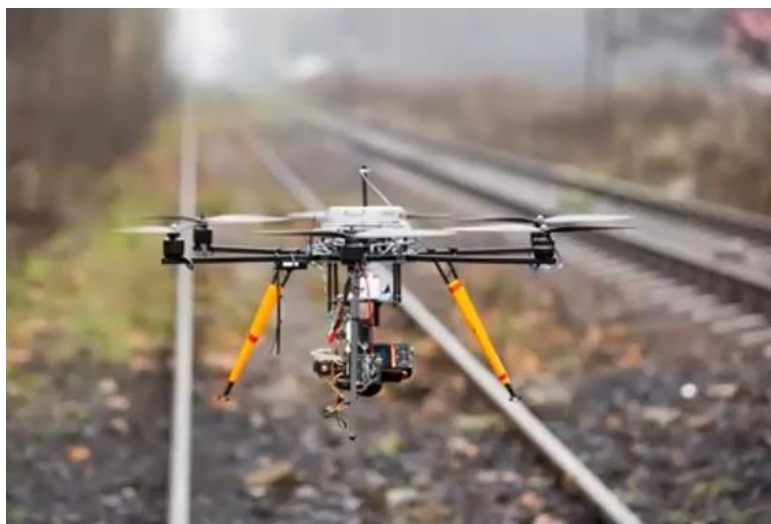
Рис. 2.4 – Безпілотний літальний апарат

Фотограмметрія на базі безпілотних літальних апаратів (БПЛА) має низку суттєвих переваг, які забезпечують її широку популярність у різних галузях. Однією з головних переваг є висока деталізація: роздільна здатність зображень, отриманих з дронів, може сягати 2–5 см на піксель, що значно перевершує якість супутникових або навіть пілотованих авіазнімків. Крім того, метод характеризується високою швидкістю зйомки — лише за кілька годин можна обстежити десятки гектарів території, що особливо цінно для оперативного збору просторових даних. Ще однією важливою перевагою є оперативність обробки: сучасне програмне забезпечення дає змогу автоматично створювати тривимірні моделі місцевості та ортофотоплани протягом доби після зйомки. Вартість такого підходу також є привабливою — дрони коштують значно дешевше, ніж класичні геодезичні прилади або традиційна аерофотозйомка з літаків. БПЛА вирізняються високою гнучкістю застосування: їх легко запускати в важкодоступних або небезпечних районах, таких як скелясті урвища, болота чи кар'єри, що значно розширює сферу використання цієї технології [17,18].