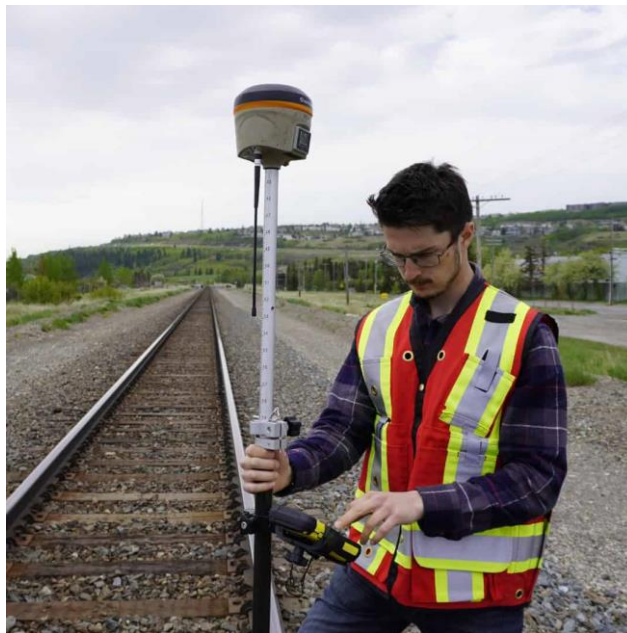
Рис. 2.2- GNSS приймач

технології вирізняються високою точністю і надійністю, адже сучасні методи дозволяють досягати міліметрового рівня точності при просторових вимірюваннях. Ще однією перевагою є універсальність застосування — GNSS придатний для вирішення широкого спектра завдань: геодезичних, інженерних, логістичних, безпекових та комерційних. Нарешті, GNSS-дані легко інтегруються з геоінформаційними системами (GIS) та інформаційно-будівельними моделями (BIM), що дозволяє ефективно поєднувати просторову інформацію з інженерними проектами та цифровою документацією [11].