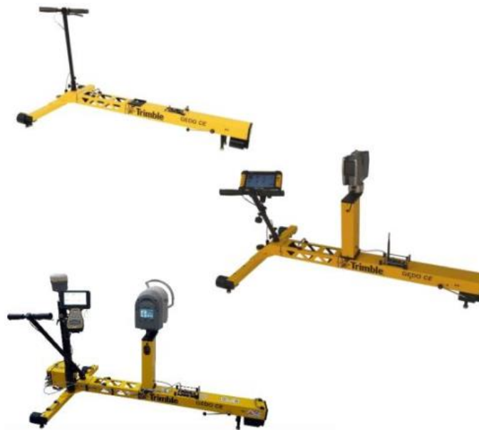
Рис. 3.5 – Обладнання Trimble GEDO

Система Trimble GEDO є одним із найсучасніших та найефективніших рішень для геодезичного супроводу при будівництві, модернізації та експлуатації залізничної інфраструктури. Завдяки поєднанню високоточного вимірювального обладнання, спеціалізованого програмного забезпечення та повної інтеграції з будівельними й ремонтними процесами, ця система демонструє суттєві переваги в порівнянні з традиційними методами [22,23].