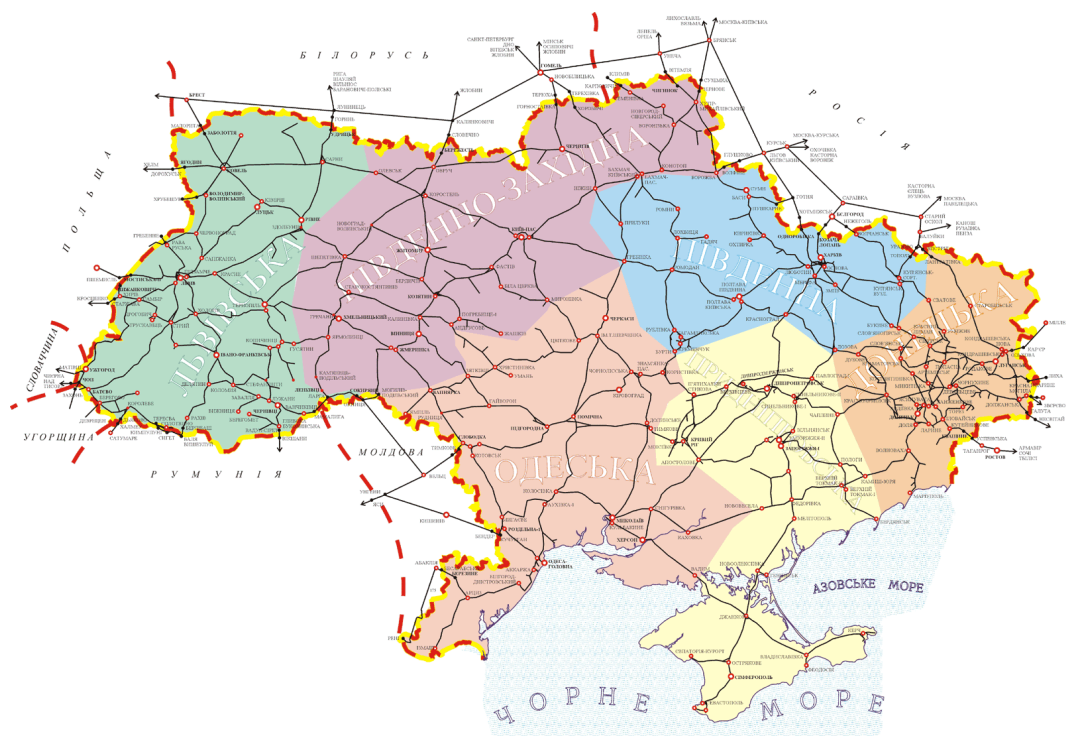
Рис. 1.1- Карта залізниць України

Залізнична інфраструктура — це складний інженерно-технічний комплекс, що включає сукупність споруд, технічних засобів, мереж та систем, які забезпечують функціонування залізничного транспорту. Вона слугує основою для організації та підтримки безпечного, ефективного та стабільного перевезення пасажирів і вантажів. Важливість надійної інфраструктури в залізничній галузі важко переоцінити, оскільки її стан безпосередньо впливає на швидкість, регулярність та безпеку руху, а також на економічні показники діяльності галузі загалом [1,2].