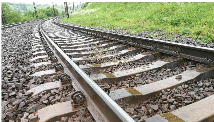
Рис.1. 2 – Залізнична колія

Залізнична колія складається з двох рейок, закріплених на шпалах, які укладаються на баластову призму. Геометричні параметри колії, такі як ширина, ухил, підйом, кривизна, повинні суворо відповідати технічним нормам, оскільки навіть незначні відхилення можуть призвести до серйозних наслідків — від зниження швидкості до аварійних ситуацій. У зв'язку з цим регулярне геодезичне обстеження колій, контроль за зміщеннями, деформаціями та осіданнями є критично важливим [3].