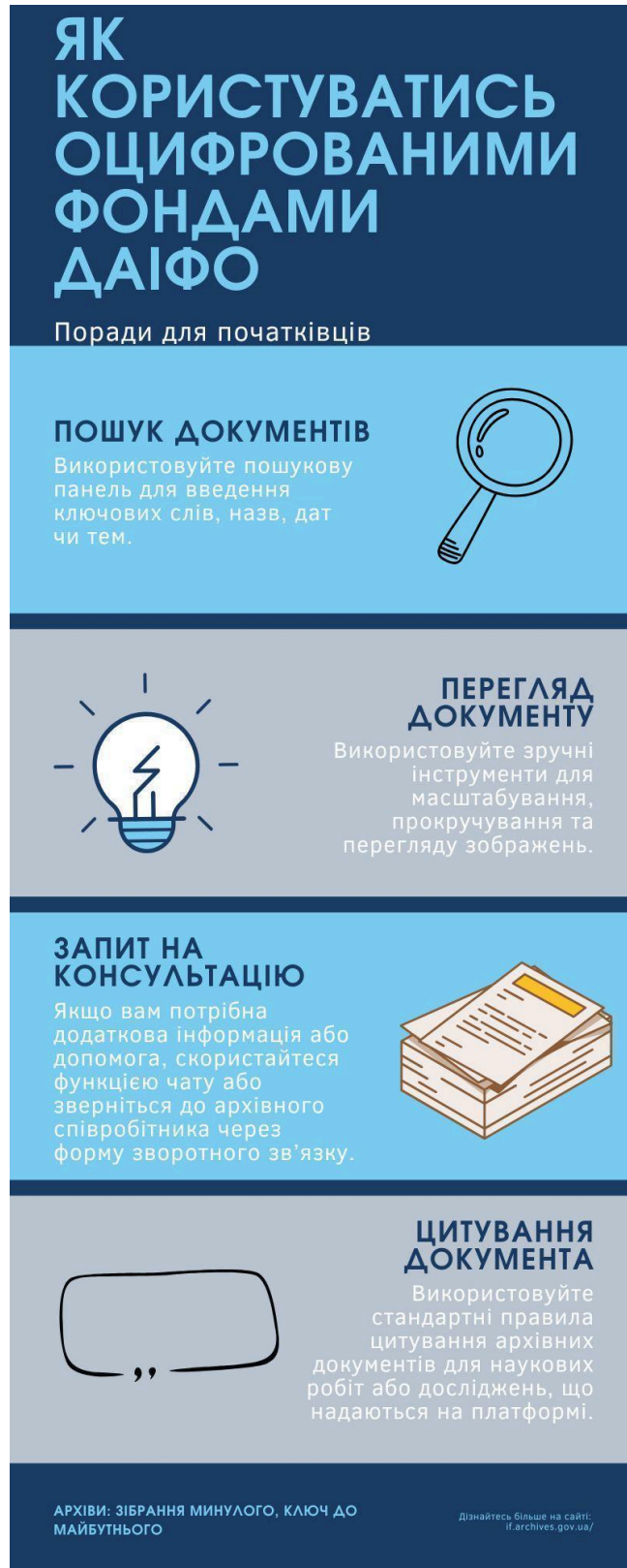
Рис. В1 – Інфографіка щодо правил користування оцифрованими документами архіву (власна розробка)