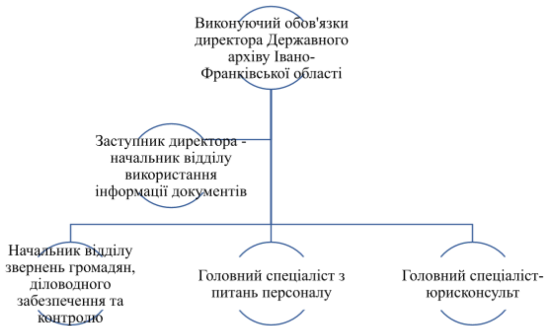
Рисунок 2.3 – Структура адміністрації ДАІФО

Також у архіві задля забезпечення ефективної архівної справи діють наступні відділи: