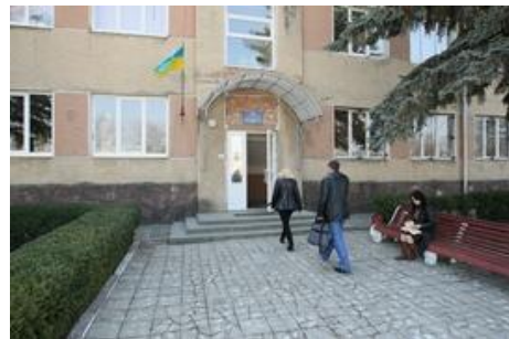
Рисунок 2.2 – Старе та нове приміщення ДАІФО

Архів був заснований у грудні 1939 року та за цей час неодноразово змінював свою назву: