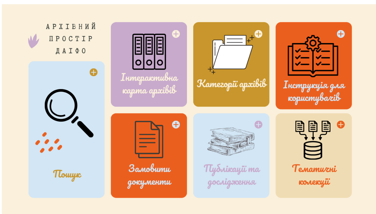
Рис. Б1 – Інтерфейс платформи для пошуку архівної інформації (власна розробка)