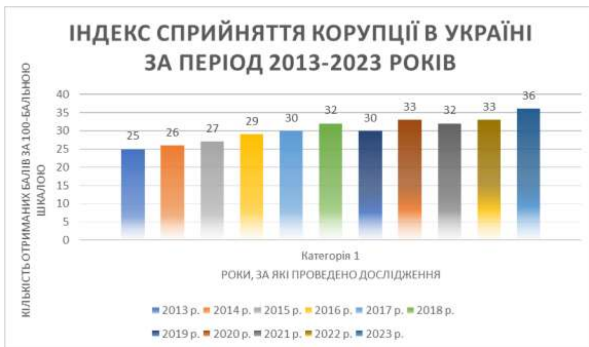
Рис. 2.1 - Індекс сприйняття корупції в Україні за період 2013-2023 років

В 2023 році індекс сприйняття корупції в Україні 36 становить балів, тоді як в році 2013 році, 10 років тому, становив 25 балів за результатами досліджень глобальної антикорупційної неурядової організації. Отже, рівень сприйняття корупції в Україні за 10 років зменшився на 11 балів, що є досить позитивним показником, проте дуже далеким від бажаного.