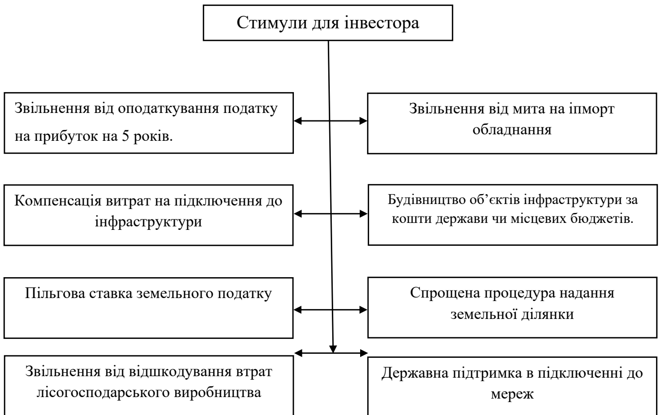
Рис. 2.1 – Стимули для інвестора

Стимули надаються лише інвестиційним проектам, щодо яких укладено спеціальний інвестиційний договір з державою, та які відповідають наступним вимогам: