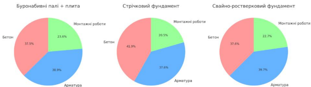
Рис.4.1. Структура витрат на три типи фундаментів (бетон – червоний сегмент, арматура – синій сегмент, монтажні роботи – зелений сегмент)