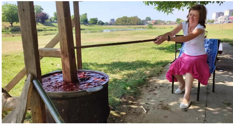
Рис. 2.8 – Фестиваль сливового леквару в селі Ботар

Традиційний фестиваль меду в Береговому є ще однією важливою подією. Березівщина відома своїми медоносами, тому фестиваль меду стає платформою для популяризації продуктів бджільництва та локальних медових виробів. Відвідувачі мають можливість скуштувати не лише мед, але й різноманітні страви з медом, медові десерти та напої.