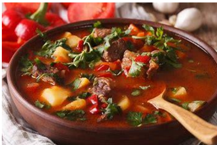
Рис 2.2 - Закарпатський бограч

Кожна страва закарпатської кухні має свою історію, символіку, способи приготування і навіть місцеві варіації. Наприклад, відомий бограч – густий м'ясний гуляш з кількох видів м'яса, паприки та овочів – є не просто їжею, а атрибутом родинних свят, народних гулянь, фестивалів. Його приготування на відкритому вогні, з дотриманням давніх рецептів, часто супроводжується цілим ритуалом, який має глибоке соціальне та емоційне значення для місцевих. Такі страви не лише насичують, а й об'єднують громади, сприяють збереженню ідентичності, передаються як частина усної спадщини з покоління в покоління (рис. 2.2).