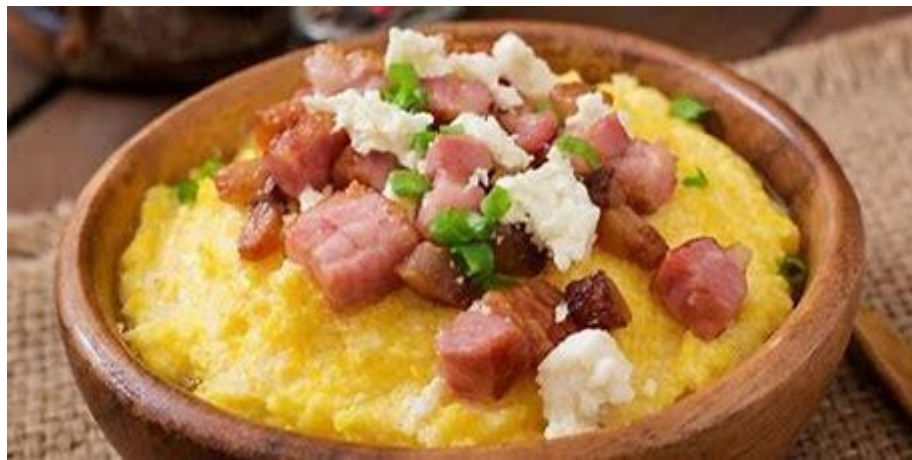
Рис 2.3 - Гуцульський банош з бринзою та шкварками

Ще однією характерною рисою закарпатської кухні є технологія приготування – вона повільна, вдумлива, з глибокою повагою до продукту. Багато страв готуються в глиняному або чавунному посуді, на дровах, з попередньою ферментацією, копченням або витримкою. Наприклад, відома страва банош – кукурудзяна каша з бринзою, вершками і шкварками – подається гарячою в дерев'яних мисках, що надає їй автентичного шарму. Такі методи не лише підкреслюють глибину смаку, але й є частиною нематеріальної культурної спадщини, яка заслуговує на збереження та популяризацію (рис. 2.3).