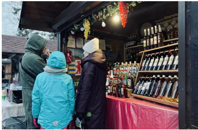
Рис 2.6 - Фестиваль вина "Червене вино" в Мукачеві

Ще один важливий фестиваль – це "Бограч-фест" в селі Середнє, що привертає увагу туристів не лише традиційними стравами угорської кухні, але й гастрономічними майстер-класами, ярмарками та концертами. Бограч – це національна угорська страва, яку готують на відкритому вогні. Тому фестиваль об'єднує не тільки гастрономічну традицію, а й національні культурні особливості, що є привабливим для гостей, які бажають доторкнутись до автентичного духу цього краю (рис. 2.7).