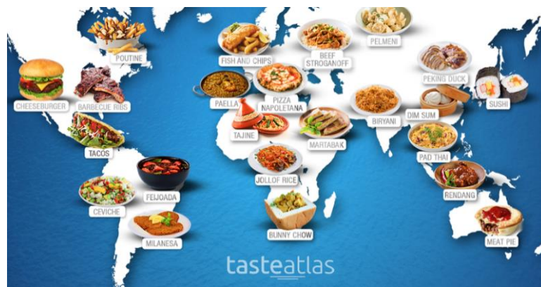
Рисунок 1.6 - Застосунок «TasteAtlas»

Також цікавим прикладом впровадження цифрових технологій є мобільний застосунок «TasteAtlas» – інтерактивна онлайн-карта світу з базою даних локальних страв, напоїв і ресторанных рекомендацій. Користувачі можуть переглядати гастрономічні особливості різних регіонів, читати відгуки, дізнаватися про найкращі місця для дегустації національних страв (рис.1.6)