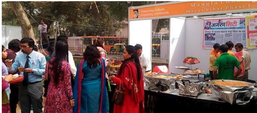
Рисунок 1.4 - National Street Food Festival в Індії

Значна частина змін у гастротуризмі відбувається завдяки впливу цифрових технологій. Роль соціальних мереж, особливо Instagram і TikTok, стала надзвичайно потужною у формуванні кулінарних трендів. Туристи шукають «інстаграмні» страви, унікальні ресторани та гастролокації, прагнучи не лише до смакових вражень, а й до візуальної привабливості гастродосвіду.