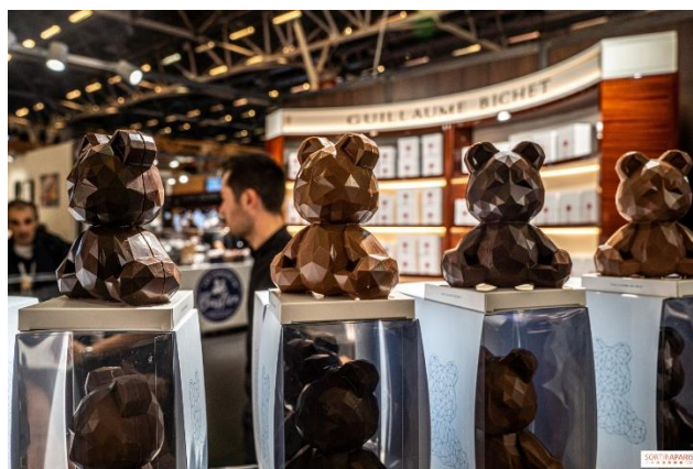
Рисунок 1.2 - Salon du Chocolat у Парижі

Фестивалі можуть бути присвячені конкретному продукту (шоколад, сир, вино, оливкова олія), типу кухні (веганська, вулична), або представляти кулінарну культуру цілої країни. Наприклад, Salon du Chocolat у Парижі щорічно приваблює понад 100 тис. відвідувачів (рис.1.2)