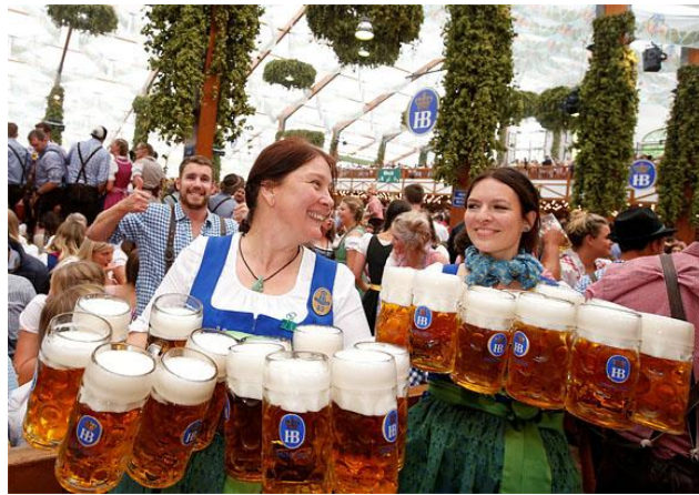
Рисунок 1.3 - Oktoberfest у Мюнхені