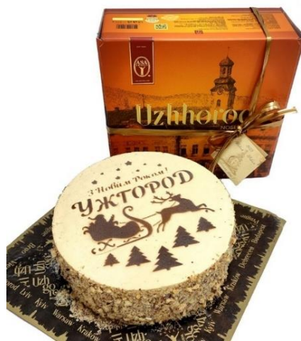
Рис. 2.4 – Торт «Ужгород»

Сьогодні торт «Ужгород» є символом місцевої гастрономічної спадщини й важливою частиною кулінарної культури регіону. Він не лише нагадує багатьом закарпатцям про дитинство та родинні свята, а й приваблює гостей краю, які прагнуть скуштувати автентичний смак Закарпаття. Багато кав'ярень та кондитерських в Ужгороді пропонують класичну версію цього торта, а дехто – й авторські інтерпретації, зберігаючи при цьому головну ідею: поєднання горіхів, крему та домашнього затишку в кожному шматочку (рис. 2.4).