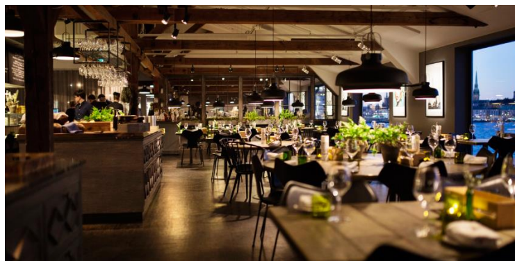
Рис.1.1 - Ресторан Fotografiska, Стокгольм

Прикладом такої практики є Швеція, де у Стокгольмі діє ціла низка ресторанів із нульовим вуглецевим слідом. До прикладу ресторан Fotografiska, який отримав Зелену зірку Мішлен за свою відданість сталому розвитку. Меню здебільшого рослинне, з акцентом на сезонні та локальні продукти. Кухня активно впроваджує практики нульових відходів: залишки хліба використовуються для виготовлення пива, а мушлі моллюсків переробляються у посуд (рис.1.1 )