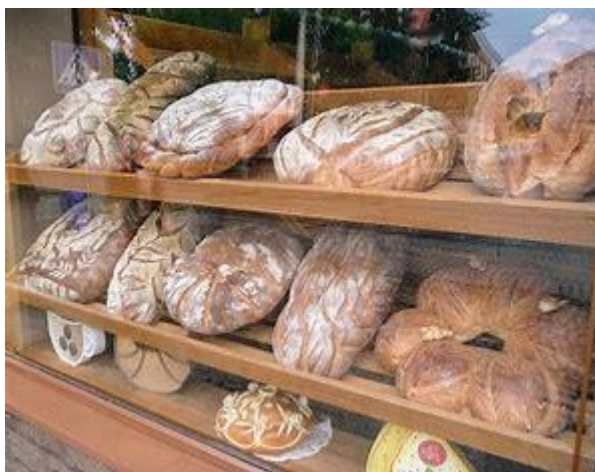
Рис 2.5 - Закарпатський хліб

Традиційна кухня Закарпаття є не просто набором рецептів, це жива культурна система, яка охоплює світогляд, звичаї, емоції і спільноту. Саме через гастрономію передається дух краю, його національна самобутність, глибина і різнобарв'я. У сучасному контексті це відкриває надзвичайні можливості для розвитку гастрономічного туризму, креативних індустрій, міжкультурного діалогу, адже кухня є універсальною мовою, яка здатна об'єднувати людей, культури та епохи.