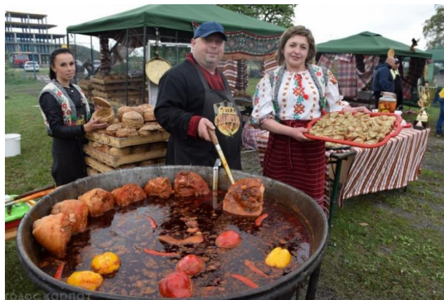
Рис 2.7 - "Бограч-фест" в селі Середнє

Ще один важливий фестиваль – це "Бограч-фест" в селі Середнє, що привертає увагу туристів не лише традиційними стравами угорської кухні, але й гастрономічними майстер-класами, ярмарками та концертами. Бограч – це національна угорська страва, яку готують на відкритому вогні. Тому фестиваль об'єднує не тільки гастрономічну традицію, а й національні культурні особливості, що є привабливим для гостей, які бажають доторкнутись до автентичного духу цього краю (рис. 2.7).