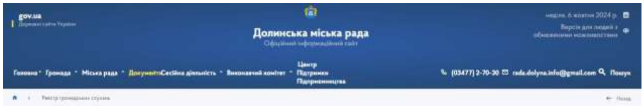
Рис. 2.1 – Діалогове вікно Реєстру громадських слухань на веб сайті Долинської міської ТГ

Позитивним моментом у взаємовідносинах Долинської міської ради та громадськості можна вважати наявність консультативно-дорадчих органів, які функціонують при міській раді, а саме: Молодіжна рада та Містобудівна рада. Правовим регулюванням таких взаємовідносин є відповідні Положення, які затверджені розпорядженням міського голови.