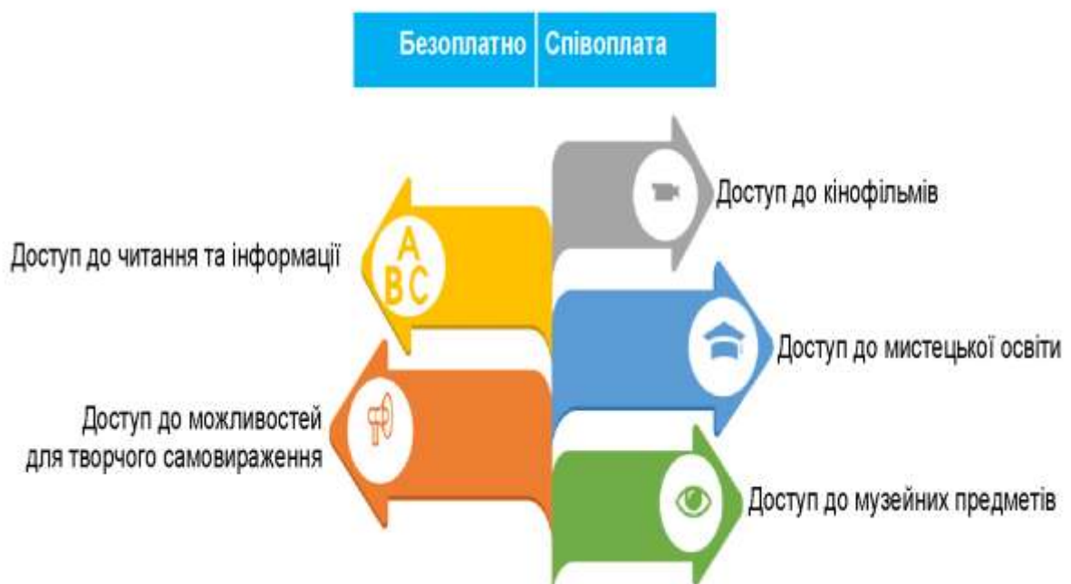
Рис. 2.1 – Базовий набір культурних послуг 40 .

Держава встановила основний комплект культурних послуг, що включає зміст, перелік та обсяг культурних послуг, які повинні надаватися мешканцям територіальної громади для забезпечення доступу до читання та інформації, кінематографічних творів, музейних експонатів, а також можливостей для творчого самовираження і мистецької освіти. На рис. 2.1 подано базовий набір культурних послуг.