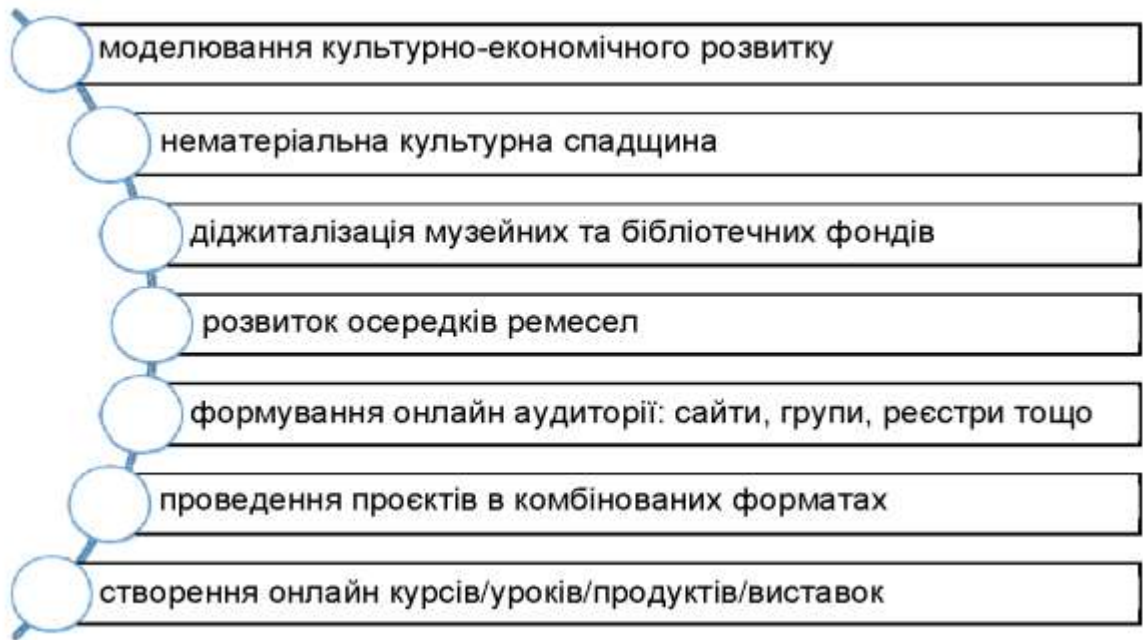
Рис. 2.2 – Культурні напрями, які можна розвивати під час роботи в онлайн-режимі 48

що дозволить збільшити кількість осіб, які інтегруються в культурну сферу та стають амбасадорами галузі, підвищуючи її підтримку в громаді.